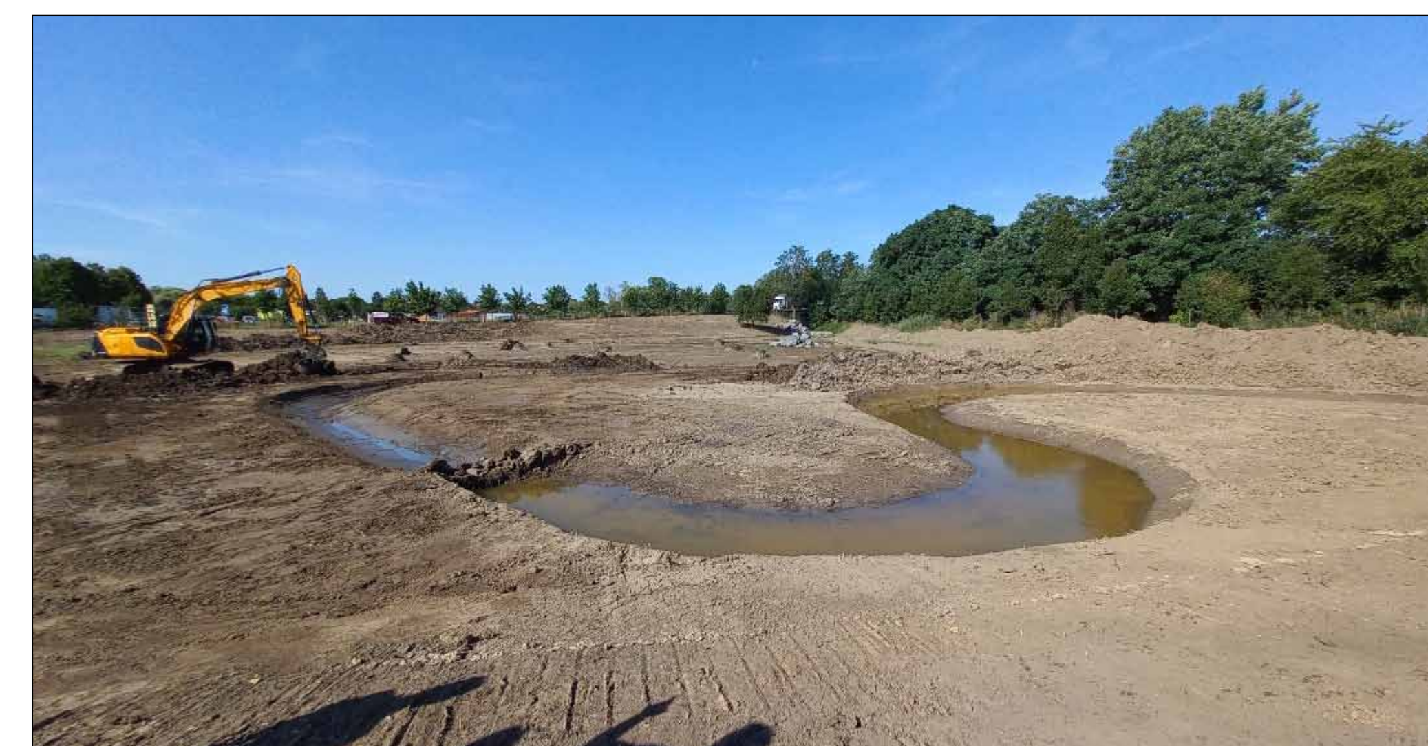
Ukázka budování revitalizačního koryta (Běchovický potok)