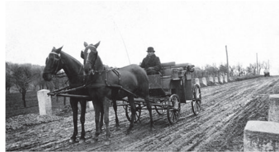
Pan továrník v bryčce tažené milovanými koňmi