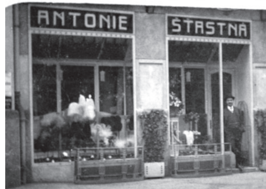
Obchod na Václavském náměstí s dílnou v 1.patře