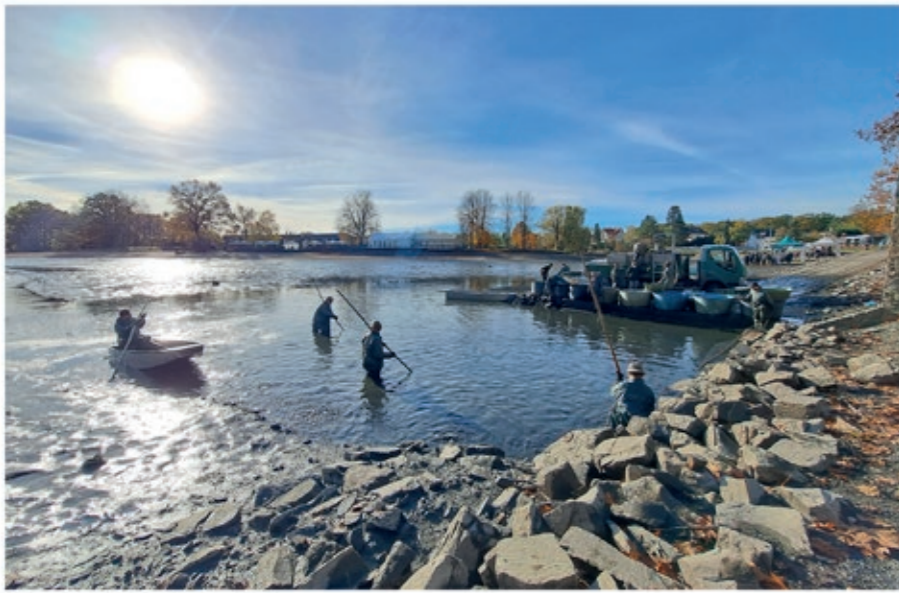
Výlov na rybníku Šeberák