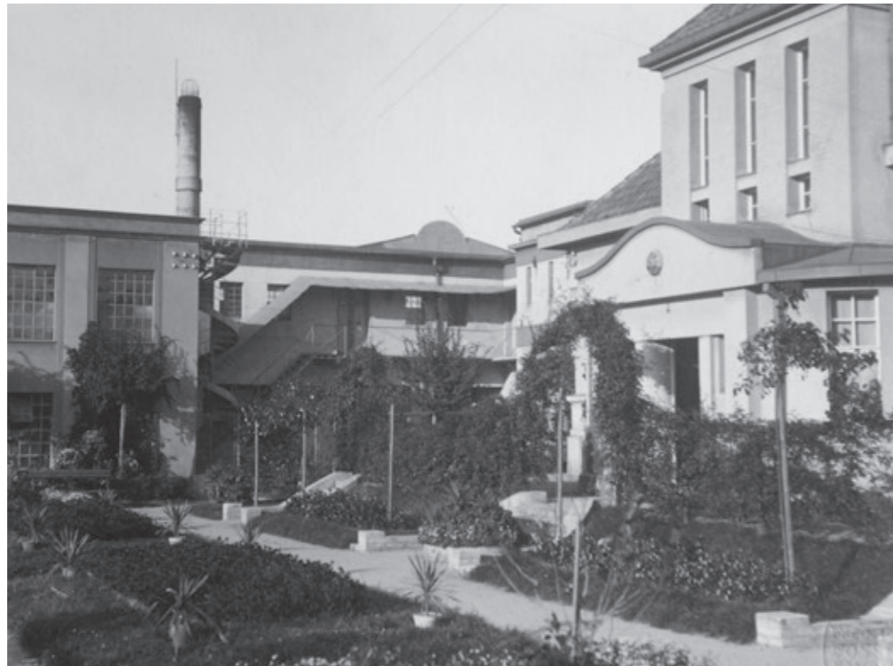
Vila se zahradou a továrnou

Peřím se pyšní nejen tisíce druhů ptáků v barvách od bílé do neuvěřitelného množství dalších barevných kombinací, ale ptačí peří se stalo také jednou z neoblíbenějších dekorací. Peří si oblíbili dekoratéri, módní i bižuterní návrháři. Péřové čelenky, péřová boa, vějíře, jsou neodmyslitelnou součástí tematických kostýmů. Od dávnověku je peří také součástí ozdoby vojenských uniforem. Nejznámější jsou péra pštrosí nebo paví, bez sojčího pera se zase neobejde žádný myslivecký klobouk. Všichni dobře známe lůžkové peří z prošívaných dek nebo peřin. Ve stanu nebo chatce během pobytu v přírodě je nejtepleji v péřovém spacáku a při pobytu venku v mrazivých dnech zase v prošívané péřové bundě. Aby se ale mohlo peří používat k účelům výše popsaným, je třeba jej příslušně upravit. Jednu takovou továrnu na zpracování peří provozovali v Kunraticích