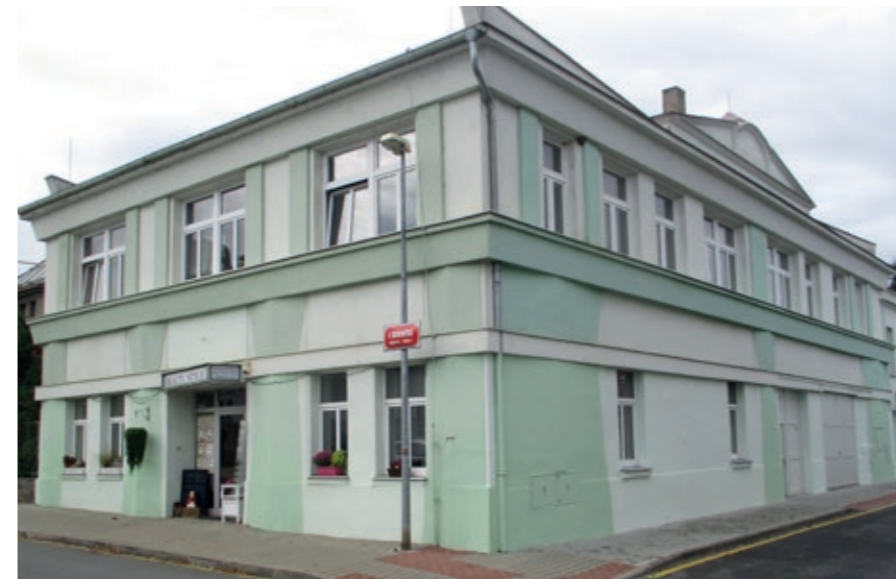
Budova bývalé továrny na zpracování peří manželů Štastných dnes