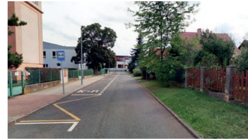
Stávající dopravní značení v této ulici

špičce zatížena velmi často opakovaným vyjížděním a vjížděním vozidel, by způsobilo ještě horší dopravní situaci v této ulici, než je dnes, kdy tam dochází v ranních hodinách k častým dopravním kongescím – zácpám. Nemluvě o tom, že počet těchto stávajících míst na ulici K Libuši, která by měla nahradit místa v Předškolní ulici s funkcí K+R, je zcela nedostačující. Ze všech výše uvedených skutečností vyplývá, že základním předpokladem pro zřízení školní ulice, která by souvisela s areálem základní i mateřské školy, je realizace dopravního průzkumu, který by jednak pomohl zjistit, jakou mírou a vzájemným poměrem jsou využívána stávající parkovací stání K+R v ulicích Předškolní, Za Parkem a Vavákova, a také by na základě do-