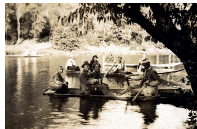
Lodičky na Mlejňáku kolem roku 1910