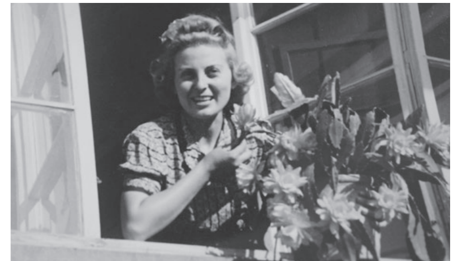
Výhled z okna a kaktusy, o které se paní učitelka stará dodnes, 1937

Sleduji to dění pečlivě v televizi. Trpí tím nesmírně všichni. Učitelé, děti a také rodiče.