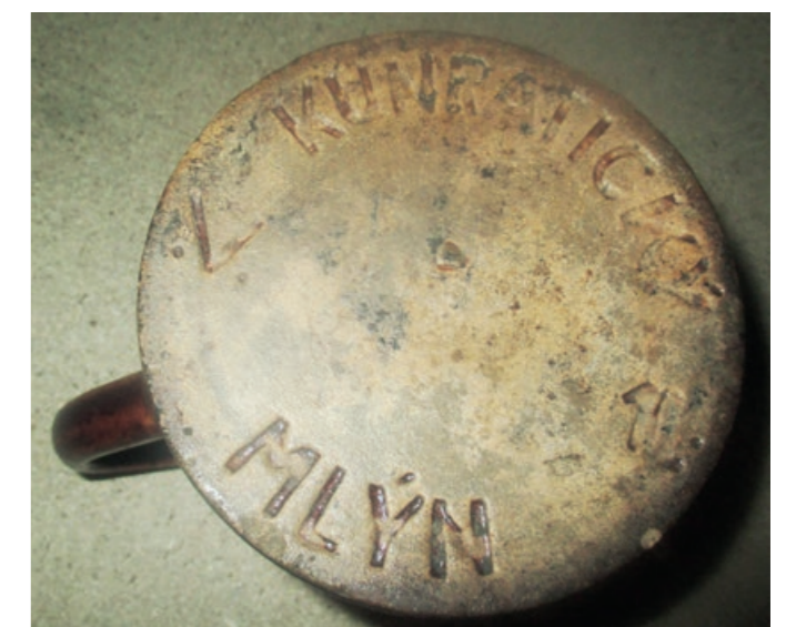
Nápis Kunratický mlýn na dně korbela