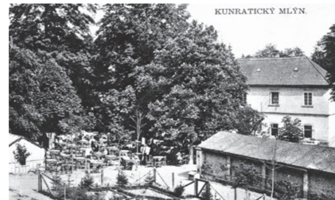
Restaurace ve mlýně kolem roku 1910. Vysoká budova sloužila k ubytování letních hostů