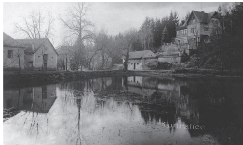
Zpustlý Mlejňák v šedesátých letech dvacátého století

Rybník procházel obdobím slávy a pustnutí. Majitel kunratického panství Korb z Weidenheimu nechal roku 1816 opravit „strhaný rybník Dolnomlýnský“. Roku 1970 měl hloubku 0,5 m, maximálně však 1,2 m, byl tedy plný bahna. Což zhoršilo v roce 1971 také následky náhlé červené povodně. Roku 1977 byla provedena částečná oprava a v roce 1982 důkladnější. Bohužel tyto opravy byly provedeny nekvalitním způsobem. Současný stav je výsledkem rozsáhlé generální opravy z roku 2011. Zbouraly se oba staré přelivy a postavily nové. U levobřežního byl mírně změněn tvar tak, aby lépe vyhovoval převádění velkých vod. Zhlaví přelivů je opatřeno kamenozřezem, jak se to již na rybnících dělá po staletí. Mlejňák zadržuje vody Kunratického potoka,