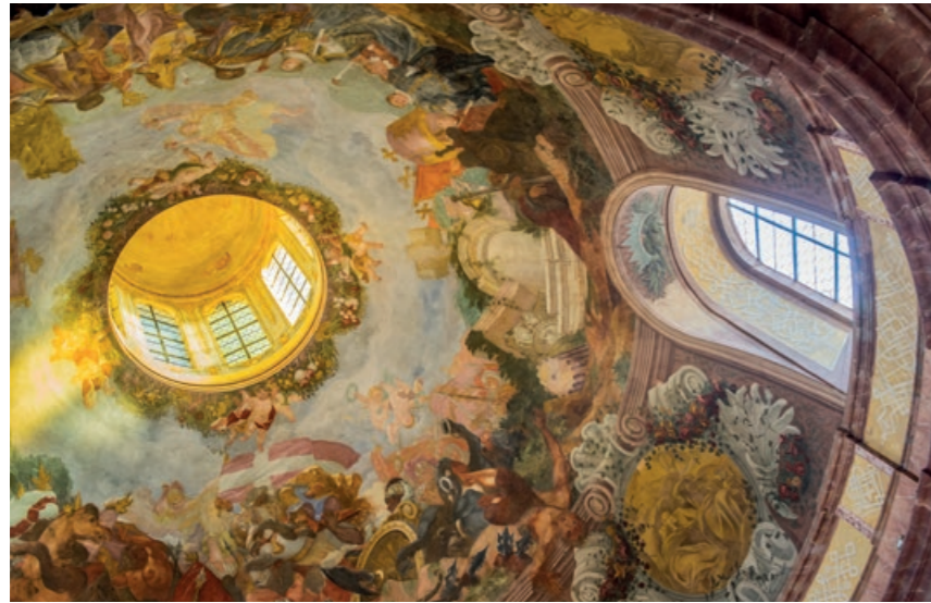
Kostel svatého Jakuba Staršího