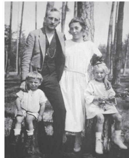
S rodinou na procházce v Borovíčku, 1925

V zimě jsme se na něm klouzali a bruslilo se tam. Jednou se děda vrátil ze služební cesty. Jezdil se spřežením s povozem. A uviděl, že se v Ohradě topili dva kluci, kteří byli z libušské školy. Křičeli o pomoc, led se pod nimi lámal a oni se čím dál víc bořili do tehdy dost hluboké Ohrady. Dědeček neváhal, skočil pro ně a oba je vytáhl pomocí dlouhého žebříku. My tehdy bydleli v domku hned naproti Ohradě. Tam je usušil a s horkým čajem je uložil do postele. Mokré bankovky, které přivezl ze služební cesty, se pak dosušovaly na posteli. Tím tyhle školáky zachránil. A po