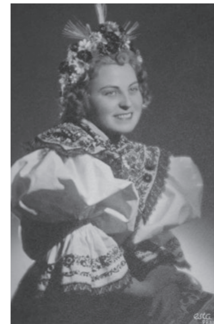
Divadelní postava Maryši, 1940