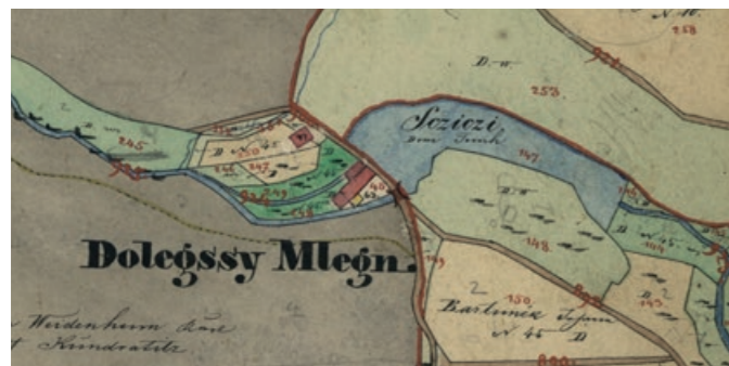
Dolnomlýnský rybník (Mlejňák, Štičí) na mapě Stabilního katastru z roku 1841

Po staletí byl rybník známý chovem ryb a také mlynářskou činností. Na staré mapě z roku 1841 je znázorněna budova mlýna a menší obděl-