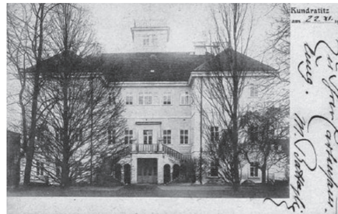
Na pohlednici z roku 1901 je schodiště do I. patra, zbourané v roce 1948