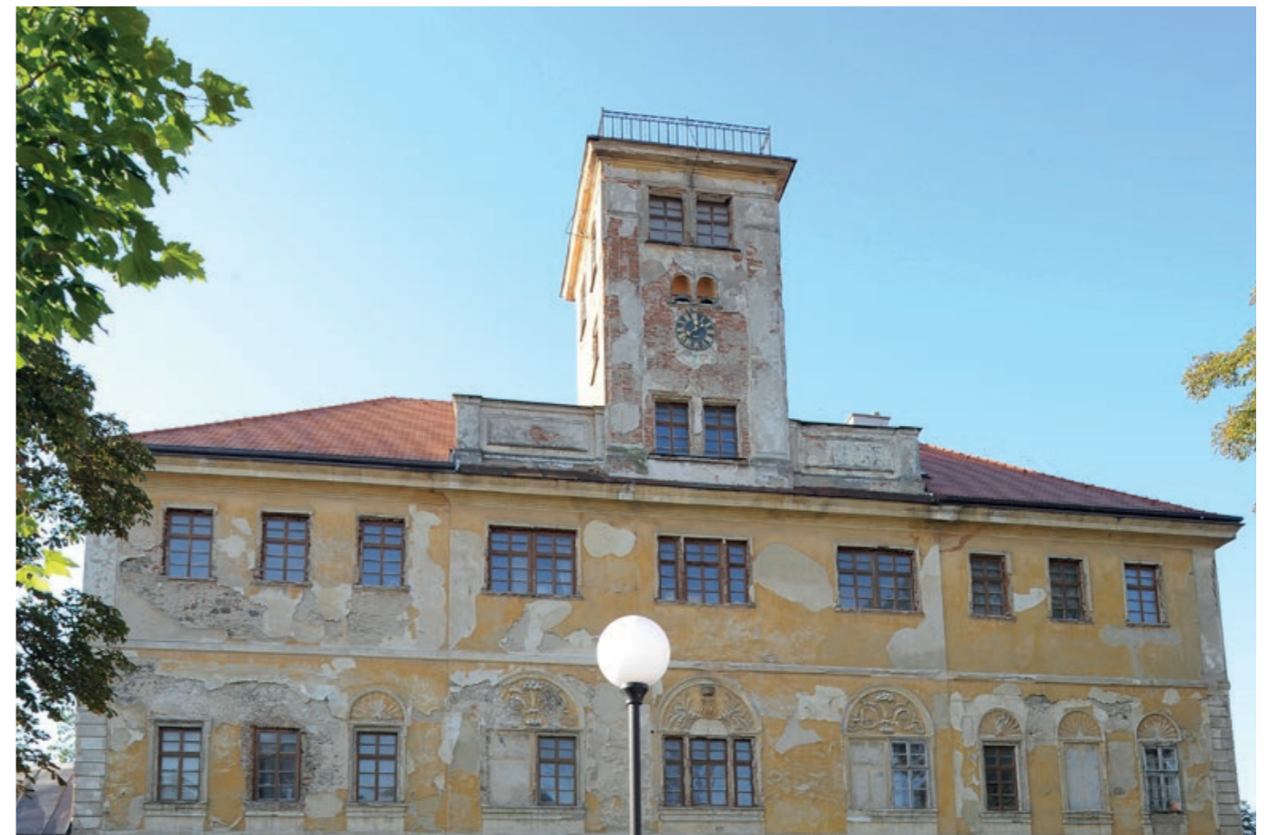
Zámek v srpnu 2024

um rozšíření hmyzu). Zdejší sbírky obsahovaly několik milionů kusů hmyzu, který sloužil jako srovnávací materiál mezidruhových rozdílů a jejich proměnlivosti. Hmyz představuje kolem 75 % všech druhů živočichů na Zemi. Podle studia zkamenělin se objevuje v období devonu před 360 až 410 miliony let. Stává se pionýrem vzdušného prostoru a dodnes nejsou zdaleka popsány všechny druhy. V zámku byly také uloženy doklady o výskytu a rozšíření hmyzu po celém světě a bohatá knihovna. Ve druhém pololetí roku 2014 se entomologické oddělení odstěhovalo se svými sbírkami do nových prostor v Horních Počernicích.