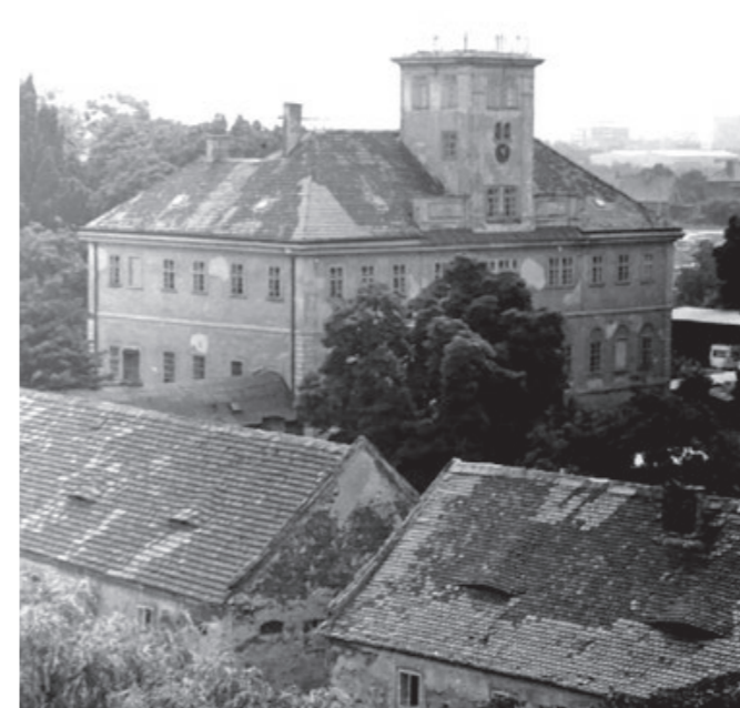
Zámek 1983

A co se stalo s ostatním běžným vybavením z části zámku, které obývala rodina Korbů z Weidenheimu? Znáám jeden příklad z vyprávění pamětníků. Za mého dětství byly Kunratice vesnice, kde všichni lidé věděli o každém všechno. Tehdy kolem roku 1956, kdy jsem jako desetiletý již mnohé vnímal, bylo ještě v živé paměti „vyklizení“ zámku v roce 1945. Největší přehled