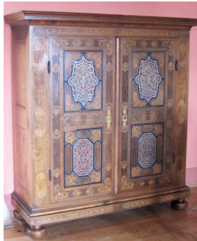
Barokní skříň ze zámku

zámku Kunratice a Loučeň. S velkou pravděpodobností je to ta, kterou zmiňuje dr. Křížová. Tato skříň byla následně zaevidována do sbírek UPM a je dnes součástí naší muzejní expozice na zámku Lemberk.“ Součástí odpovědi byla i fotografie skříně, a tak si ji můžete při návštěvě zámku Lemberk prohlédnout.