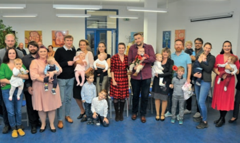
9. 10. jsme opět na radnici přivítali kunratická miminka.