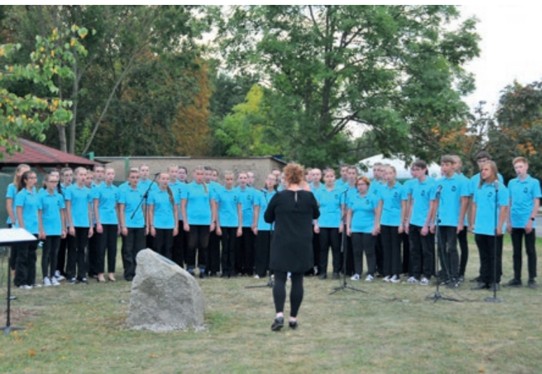
Vzpomínková akce u stromu Olgy Havlové