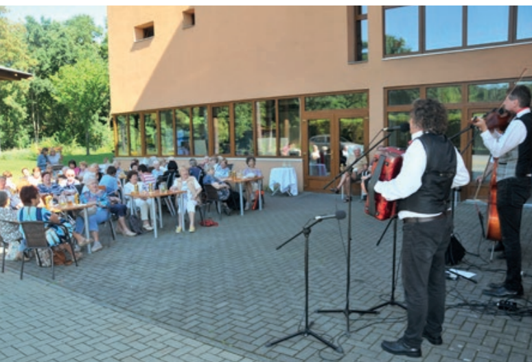
Grilování na zahradě domu s chráněnými byty