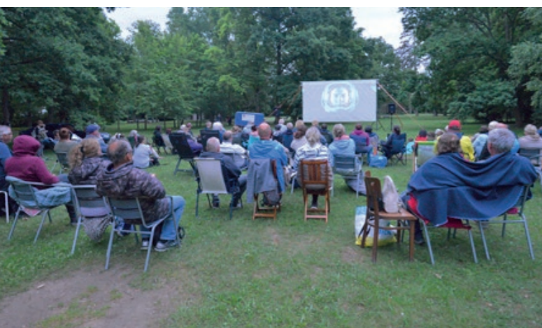
Promítání letního kina v zámeckém parku