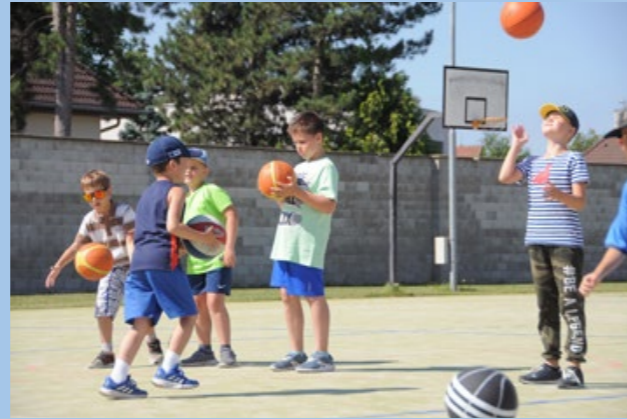
Basketbalový příměstský tábor 2020