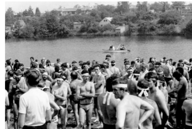
Triathlon z roku 1987 na počest 700. výročí trvání obce Kunratic