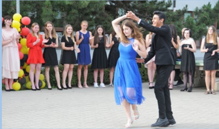
Rozloučení s žáky devátých tříd