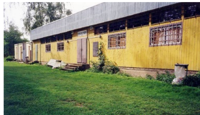
Bývalé šatny před zahájením přestavby v roce 2009

Provoz restaurace byl ve druhé polovině osmdesátých let ukončen a stavba v roce 1989 odstraněna. Od roku 1991 pronajímala MČ Praha – Kunratice koupaliště soukromým podnikatelům, kteří poskytovali v období koupání nebo bruslení občerstvení v budově šaten.