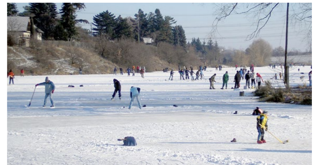
Bruslení na Šeberáku v lednu 2009