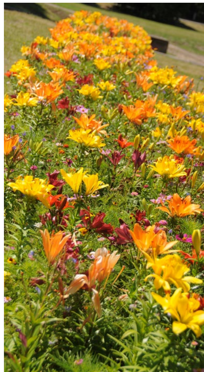
Záhon lilií u rybníčku Ohrada

– úpravu rozpočtu č. 6., přesun 71,8 tis. Kč z rezerv a 60,0 tis. Kč mezi položkami uvnitř par. 3111 mateřské školy – spoluúčast MČ k programu OP PPR Rozvoj polytechnické výuky a EVVO na MŠ Kunratice, – úpravu rozpočtu č. 8., posílení par. 3412 o 600,0 tis. Kč – výměna oplocení na hřišti SK Slovan Kunratice, – změnu rozpočtu č. 10, zvýšení 148,8 tis. Kč neinvestiční dotaci HMP pro Základní školu Kunratice v rámci Programu prevence sociálního vyloučení a otvírání hřišť pro rok 2020 na projekt „Otevření školního hřiště pro veřejnost v době mimo školní výuku včetně víkendů a pokrytí zvýšených finančních nároků na jeho údržbu“, – změnu rozpočtu č. 11, zvýšení o dotaci 675,0 tis. Kč v rámci Operačního programu Praha - pól růstu ČR, městské části Praha - Kunratice Mateřské školy Kunratice.