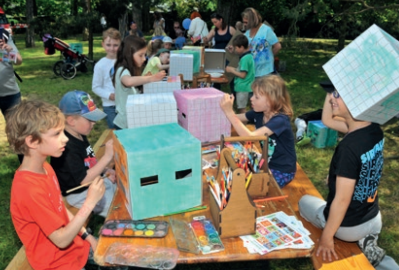
Divadlo v parku