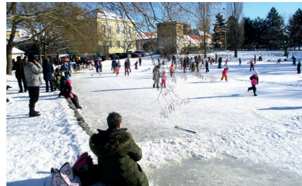
Únor 2021 malým bruslařům přál.

dráhu. Dívání jsme se z blízkosti na tréninky sportovců s „dlouhými noži“ a po jejich skončení bylo pak na jejich dráze brusleníčko jedna radost. Pamatuji se, že jednou někdo upravil v zadní části Šeberáku plochu pro trénink mladičké krasobruslařky. Právě před padesáti lety, v únoru 1956, byl v Kunraticích dokonce vytvořen i stadion s umělou plochou. „Kovoňáci“ polili vodou hřiště kopané, postavili mantinely a zavedli osvětlení. Pak se hrálo vždy večer několik hokejových utkání do té doby, než polevily mrazy a led zmizel v nenávratnu. Odpoledne jsme tam mohly chodit bruslit i my děti.