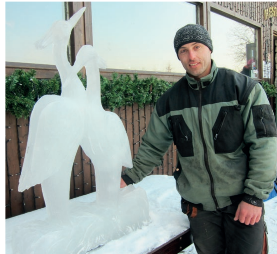
Zamílované ledové volavky sochaře Jiřího Nekoly (2012).