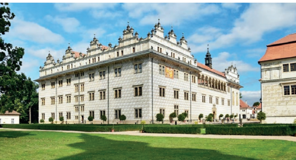
Renesanční zámek v Litomyšli

Poplatek je možné zaplatit převodem na účet městské části, nebo přímo v pokladně úřadu v hotovosti či platební kartou. Bližší informace Vám poskytne paní Chalupová tel: 244 102 210, chalupova@praha-kunratice.cz .