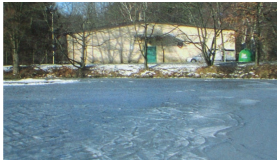
Budova bývalé ledárny, v současnosti skladu, u hráze Šeberáku (2008).