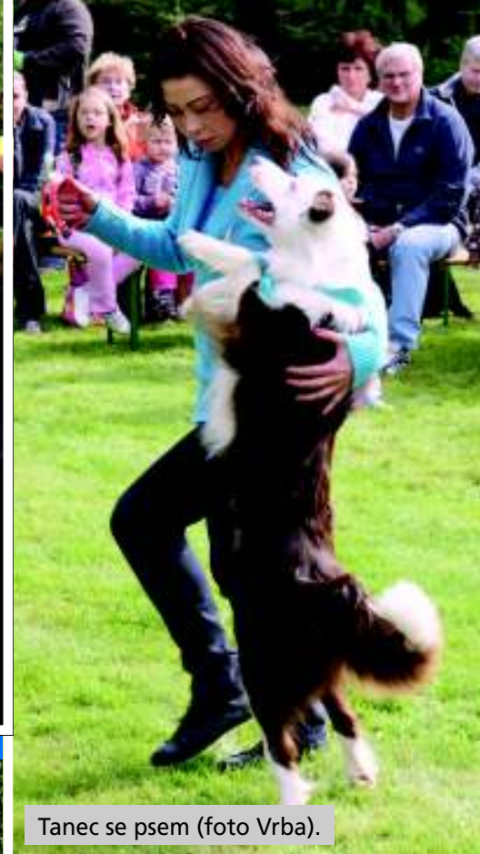
Tanec se psem.