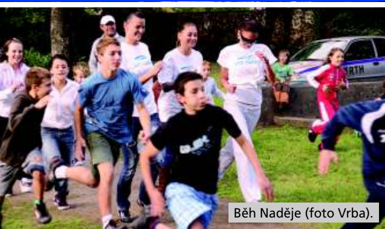
Běh Naděje.

Kdo popustil fantazii trochu z uzdy, mohl se v duchu přenést vlastním strojem času na nádvoří středověkého hradu. Začala hrát kapela Dum Dooble Doobie Band. Po chvíli vyhrávání zhaslo světlo, kolem louky se rozsvítily koule a siluety stromů. Vytrvalí návštěvníci pak mohli ještě setrvat v poslechu hudby či víru tance. Závěr se ale nezadržitelně přibližoval. (my)