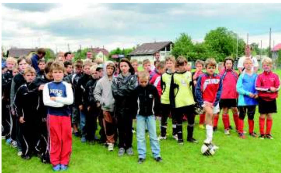
Turnaj se za teplého počasí rozhodně nehrál.

V sobotu 28. srpna se na našem hřišti odehrál turnaj mladších přípravků – hráčů narozených v letech 2002 až 2004. Za hezkého počasí si vítězství vybojovali malí fotbalisté Dubčce, naše mužstvo skončilo na pěkném třetím místě. Druhý den, v neděli 29. srpna, se sešlo v Kunraticích 12 týmů starších přípravků – hráčů narozených v letech 2000 a 2001. Mezi účastníky se objevili hráči Sparty Brno a také Juventusu Bruntál, kteří do Prahy přijeli vlastně poprvé. Náš klub v této kategorii postavil mužstva A i B, což je důkazem rozvoje mládežnického fotbalu v Kunraticích. K vidění byly hezké akce mladých adeptů fotbalu. Celý turnaj proběhl bez problémů a spokojenost dětí byla pro naše trenéry mládeže odměnou za práci spojenou s organizací této akce. Vítězství si nakonec odvezli hráči Brna, druhá skončila