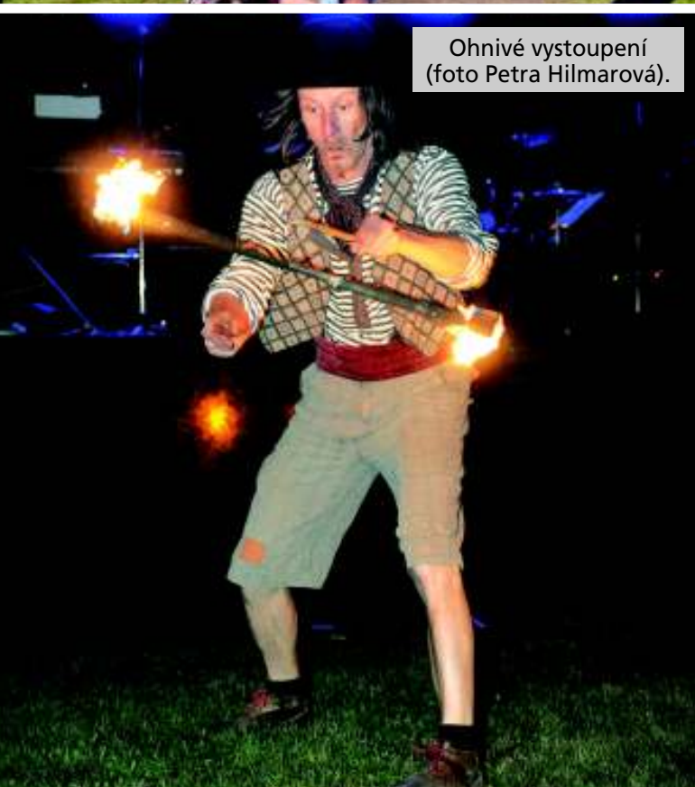
Ohňivé vystoupení.