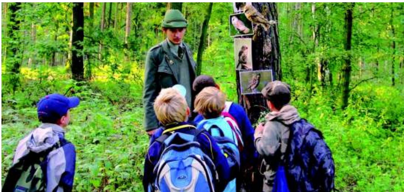
Zastávka na ptačí stezce.