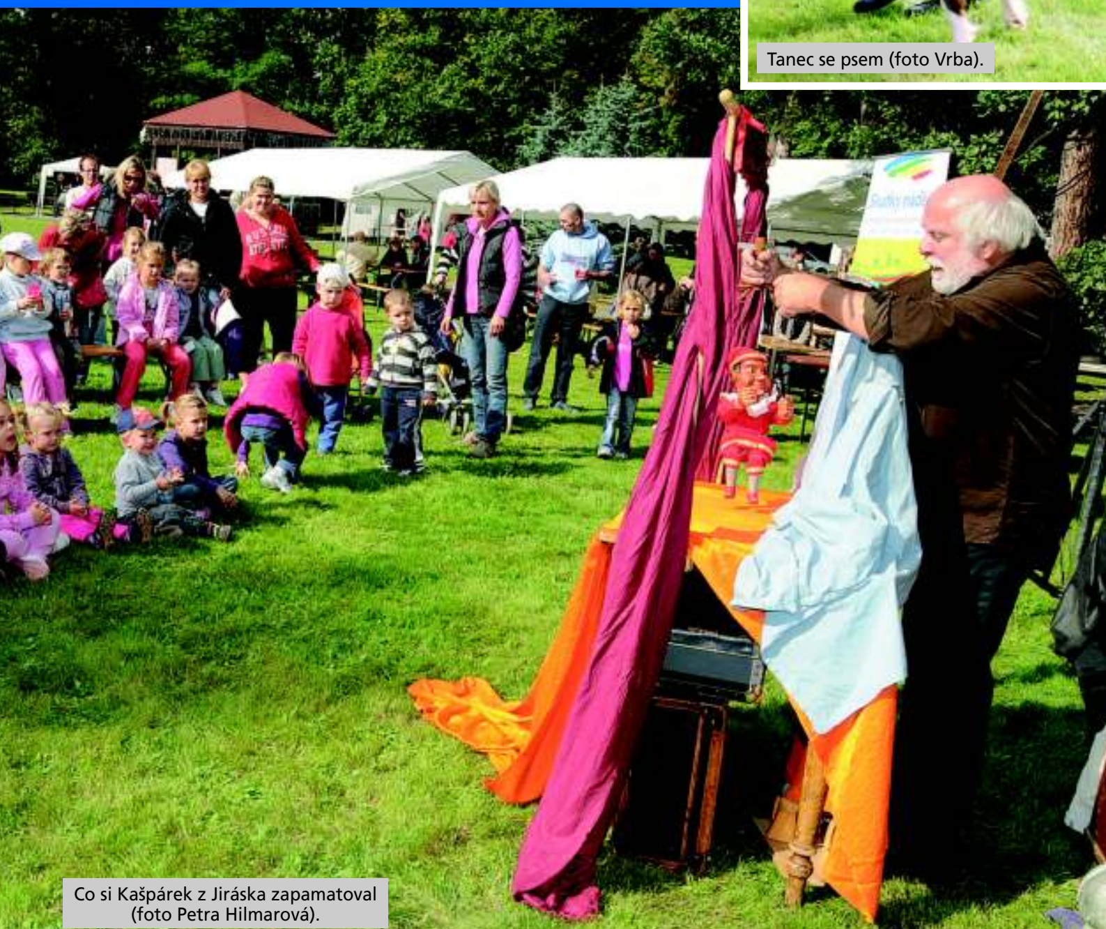
Co si Kašpárek z Jiráskův zapamatoval.