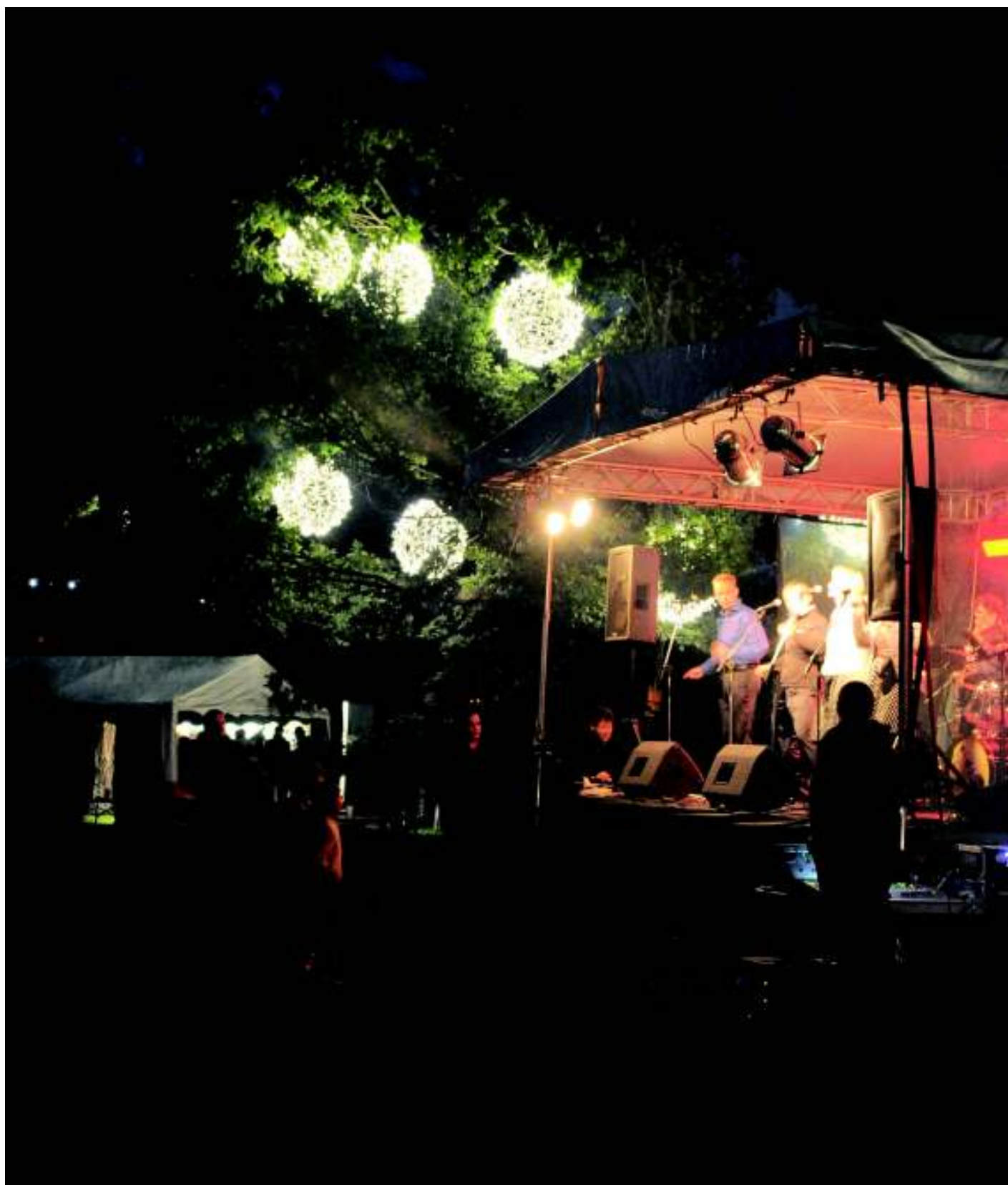
Osvětlený park s kapelou Dum Doobie Doobie Band v sobotu 18. září.