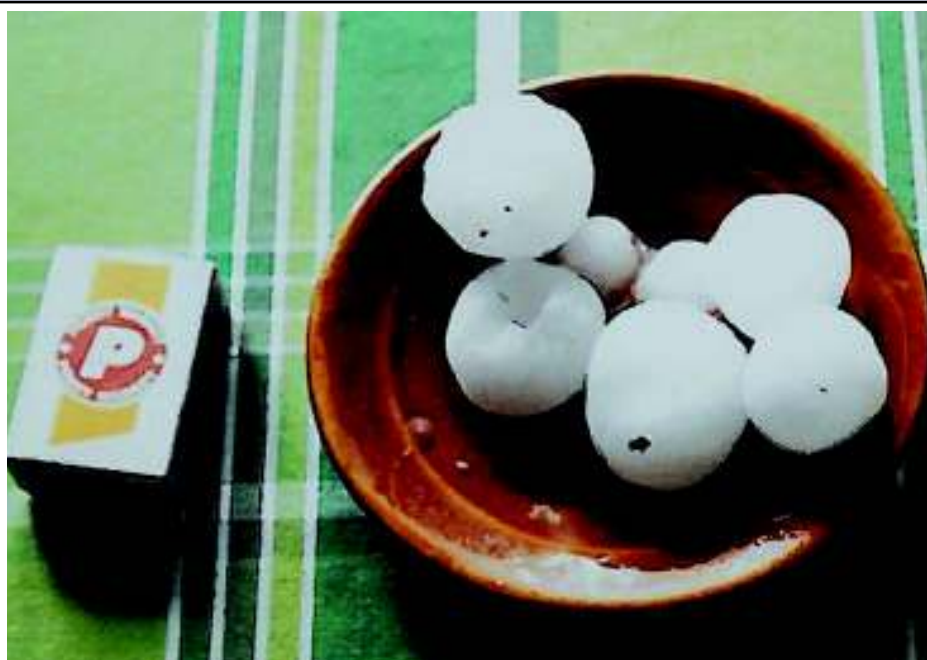
Kunratická srpnová „pomlázka“, kroupové slepence značných rozměrů.

Letošní nedělní večer 15. srpna přinesl do Kunratic nepřijemné překvapení. Kroupy. A pořádně veliké. Některé kousky měly i 3 nebo 5 cm v průměru, velikost „holubího vejce“. Tedy tímto termínem se v minulosti velikost běžně označovala. Kolik dnešních lidí ale dnes ví, jak takové