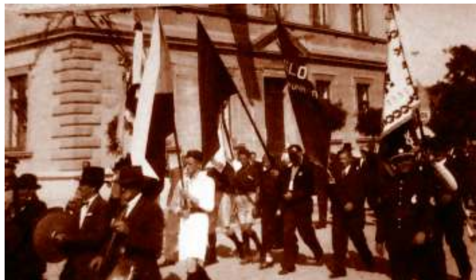
Slavnostní průvod prochází před starou školou v ulici K Libuši.