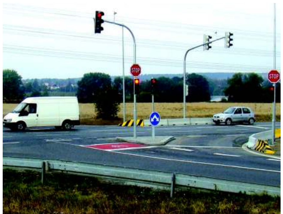
Světelná signalizace křižovatky Kunratická spojka-K Labeškám již slouží (foto my).

Původně to měla být křižovatka okružní. Dobře postavená a seřízená světelná křižovatka má (SSZ) ale větší kapacitu.