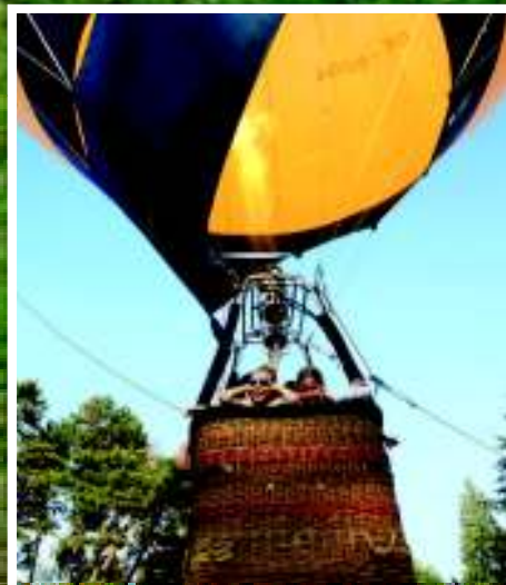
Balon s dětmi se zvedá nad loukou.