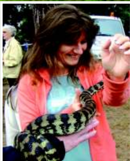
V Praze se dá odchytit i krajta.