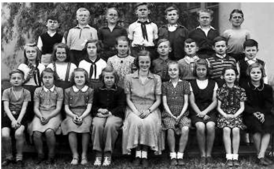
Čtvrtá třída 1950/51.

školách, kdy učila převážně první třídy a setkala se s nepřeborným počtem žáků. Na svou kunratickou čtvrtou třídu, kterou svou učitelkou pouť zahajovala, ale nezapomněla. Velice nás všechny dojalo, když závěrem prozradila, že toto setkání je krásnou tečkou za jejím letošním osmdesátiletým životním jubileem. Paní učitelce přejeme ještě jednou hodně zdraví a jak jsme si navzájem slíbily, za rok na shledanou.“ Ing. Svatomír Mydlarčík