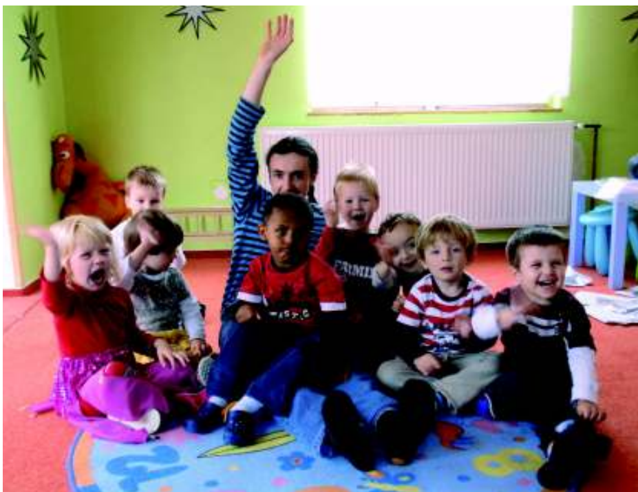
Hrajeme si anglicky.