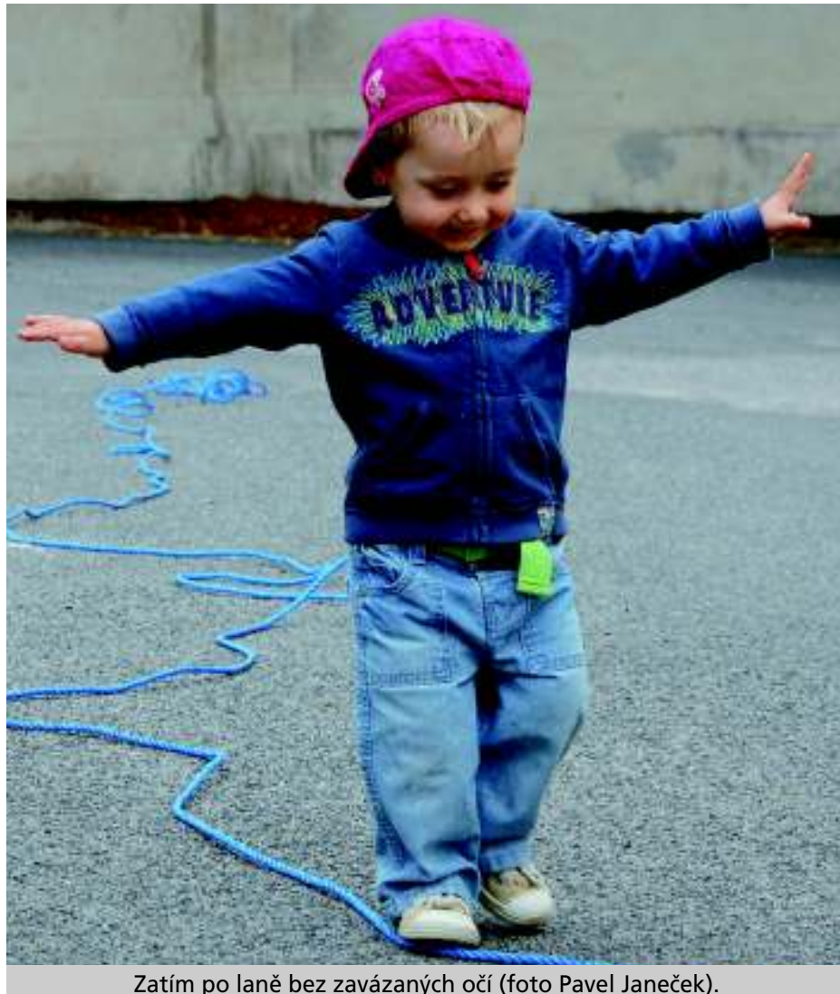
Zatím po laně bez zavázaných očí.