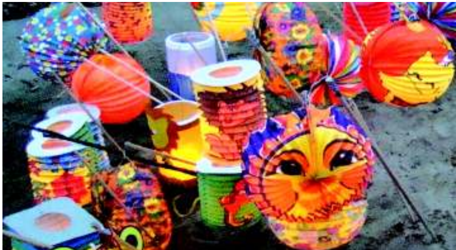
Lampionová šatna.