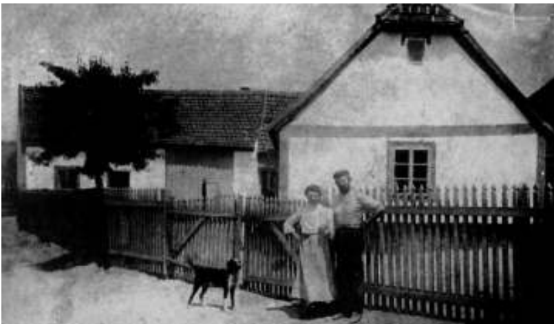
Dům č. p. 62 z roku 1900. Stavba v pozadí je původně konírna z roku 1865.