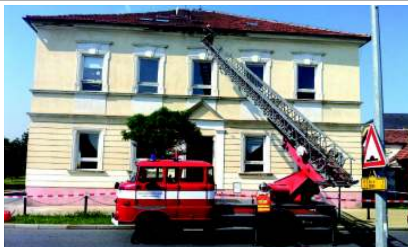
Odstraňování uvolněné omítky z římsy staré školy.

Nejznámější jsou výročí po 25 letech, svatba stříbrná nebo po padesáti letech