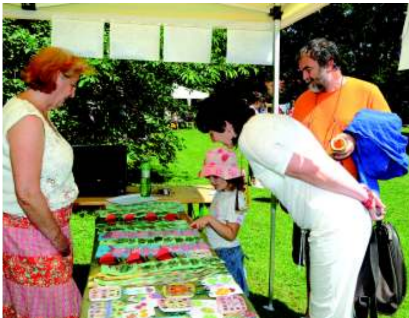
ZŠ maluje pro OS Křižovatka.