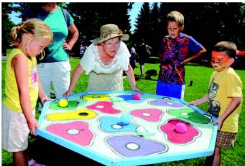
Soutěžilo se v mnoha disciplínách.

Na závěr školního roku 2011/12 obohatila společenský život v Kunraticích tradiční Zahradní slavnost Základní školy Kunratice. Poslední červnové úterní odpoledne se opět stal její areál rájem nejen pro žáky, ale i rodiče, pedagogy a přátele školy. Pozvání přijali a využili k neformálnímu setkání i mnozí místní občané. Sdružení rodičů Patron ve spolupráci se Střediskem volného času při ZŠ Kunratice a za podpory místních řemeslníků a podnikatelů, obchodních partnerů školy a sponzorů vše pečlivě připravili. Návštěvníci využívali sportoviště s pákárským tunelem, florbalovým náčiním, skákacím hradem, trampolínou a chůdami nebo si na zahradě prohlíželi supermoderní sanitku a zkoušeli různá řemesla. Hlavně si ale mohli v „rodičovských dílničkách“ vyrobit dárek na památku nebo načat krásně namalovat obličej. Pro rodiče předškoláků byla připravena stanoviště pro nejmenší a hlídací koutek. Letošní téma „Letem světem“ umožnilo organizátorům připravit pro děti rozličná stanoviště s přitažlivými dovednostními úkoly. Základní program plný her, sportu, hudby a řemeslných dílniček se tak rozrostl do mnoha atrakcí, ze kterých si mohl vybrat skoro každý návštěvník bez ohledu na věk.