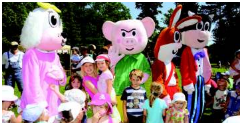
Fifinka, Bobík, Piňďa a Myspulín opět mezi dětmi v parku.

Kunratický zámecký park navštívili v loňském roce kreslené postavičky pana Jaroslava Němečka Piňďa, Bobík, Fifinka a Mys-