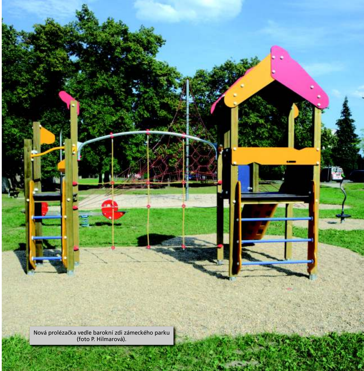
Nová prolézačka vedle barokní zdi zámeckého parku.