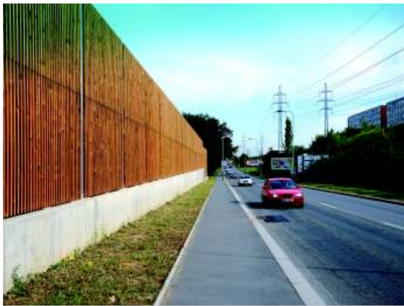
Nový chodník podél ulice Ke Kunratickému lesu.