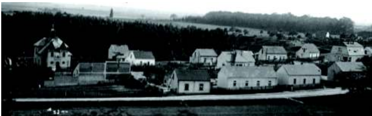
V kunratickém „Edenu“.