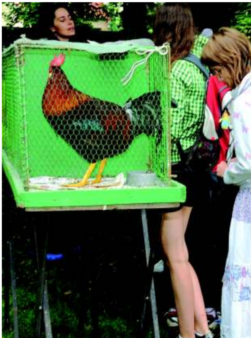
Kohout „Vlašák“ kunratických chovatelů na Dnu Čtyřlístku.

Postupným poválečným zlepšováním zásobování začal upadat zájem o chov koz. Několik let po válce byl proto zrušen odbor kozářský. Po různých reorganizacích (v roce 1947 byl přejmenován na Jednotu chovatelů drobného hospodářského zvířectva pro Zemi moravskou a českou a od roku 1970 na Český svaz chovatelů drobného hospodářského zvířectva) se stala kunratická základní organizace součástí Pražského sdružení. V šedesátých letech minulého století dodávala místní organizace bezplatně