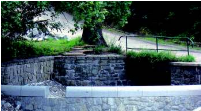
Nový kamenný levobřežní přeliv Mlejňáku s dubem, který za sto let pěkně povyroste.