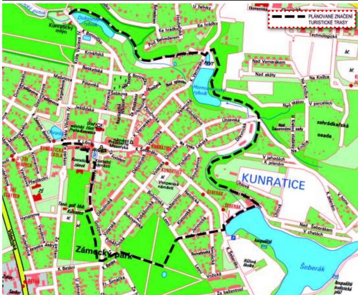
Mapa Kunratic s připravovanou turistickou trasou.