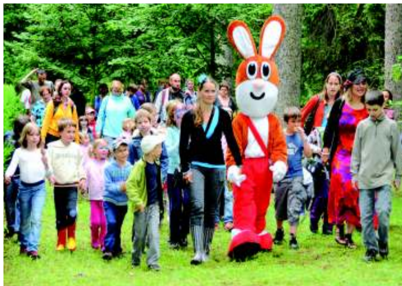
Piňďa s přáteli.

některého ze čtyř hrdinů. Na hlavní louce parku se těšila zájmu odvážnějších veliká nafukovací ryba. Nejdříve otevřela tlamu, do které vlezly děti po malých schůdkách. Pak je všechny spolkla, ale vše dobře dopadlo, neboť hrdinové vyjeli po skluzavce zezadu ven. Díky místním chovatelům zde byli přítomni i tvorové živí a čím dál tím vzácnější. Domácí holubi nebo velký kohout plemene Vlaška koroptví zvaný obecně „Vlašák“. Nejmenší děti si také mohly zarybařit v bazéncích s umělými rybami. Celý den bylo sice počasí pošmorné, ale to dětem i rodičům, přátelům Piňdi, Bobíka, Fifinky a Myšpulína, nevadilo. (my)