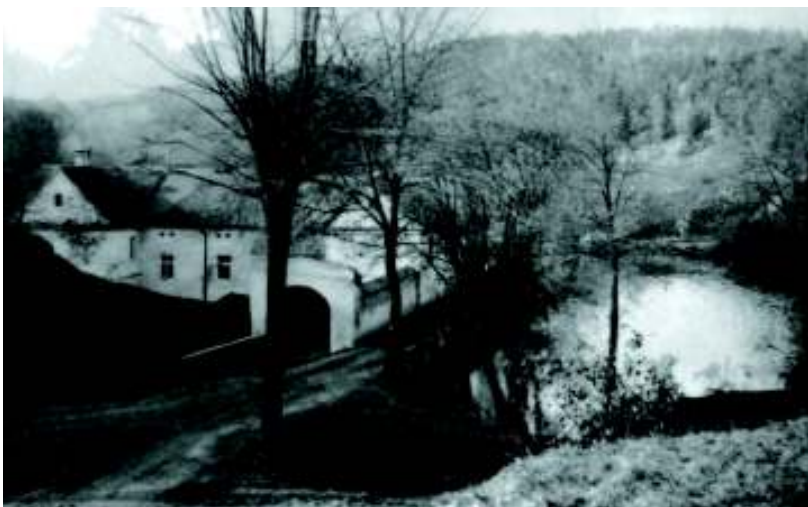
Mlejňák s Dolním mlýnem s levobřežním přelivem a dubem přibližně před sto lety.

Projdeme podél dvou památných stromů, zabočíme doprava na hlavní cestu v Bažantnici, poté parkem a Golčovou ulicí přes Tvrz Kunratic k zastávce autobusů Kunratická škola u Ohrady. Zde nyní končí žlutá značka vedoucí od „Mlejňáku“ společně s cyklistickou trasou A 212 směr Jesenice. Znovuoživení této romantické části Kunratic bude jedním ze splněných bodů volebního programu kunratického zastupitelstva i naplnění záměrů několika místních občanských sdružení. Cesta se stane zcela určitě oblíbenou trasou nejen rodičů s dětmi, ale i ostatních návštěvníků Kunratického lesa, kteří nyní končí díky nedostatečnému značení u Ohrady a míjejí Kunratic. Změnu také výrazně pocítí místní podnikatelé v pohostinství. Prodloužení trasy bude budováno postupně. Nejdříve se označí úsek Ohrada-park-Bažantnice-zastávka MHD