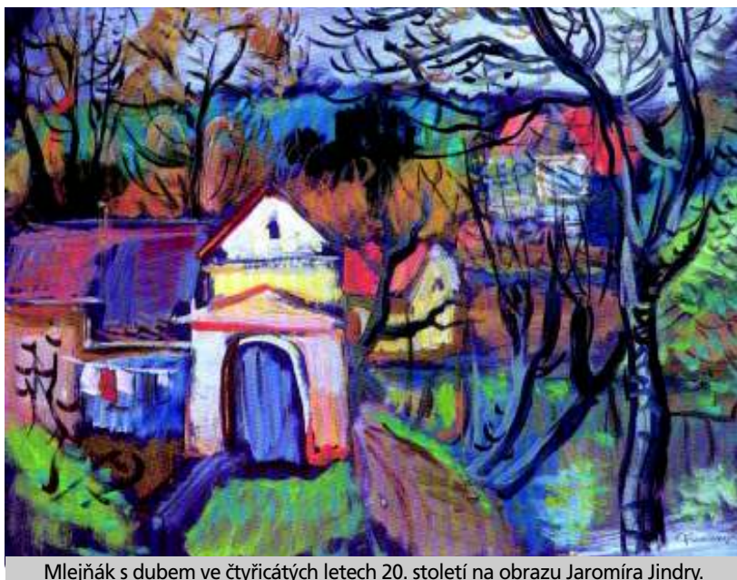
Mlejňák s dubem ve čtyřicátých letech 20. století na obraze Jaromíra Jindry.

Mlejňák se ale v příštím roce pravděpodobně dožívá významného jubilea 600 let. Cyril Merhout uvádí ve své knize z roku 1912 Čtení o Novém hradě a Kunraticích, že „roku 1412 prováděny pod hradem obranné podniky vodní. Jakub, lamač kamenů musel se pod trestem smrti zavázat, že provede dílo rybníčné, které mělo vyplnit celé údolí pod hradem“. Jednalo se již o Mlejňák, nebo ne?