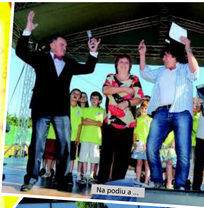
Na pódium a ...