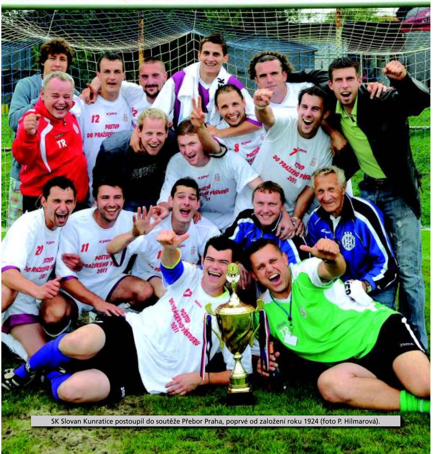
SK Slovan Kunratice postoupil do soutěže Přebor Praha, poprvé od založení roku 1924.