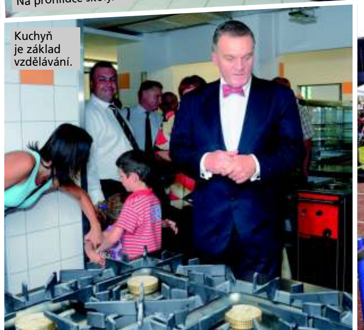
Kuchyň je základ vzdělávání.