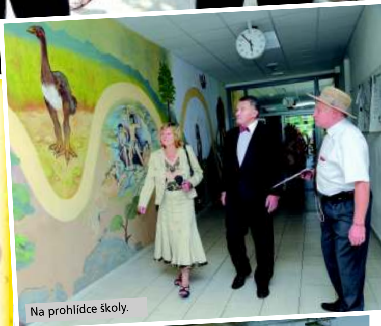
Na prohlídce školy.