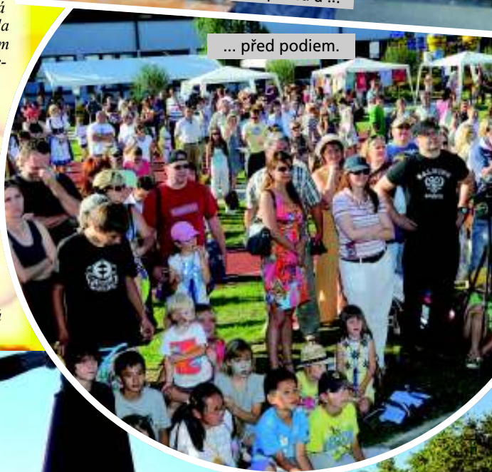
... před pódium.