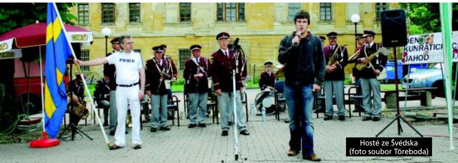
Hosté ze Švédska (foto soubor Töreboda)

Nechyběl ani hudební doprovod. Odpovědně zahájila kapela až z dalekého švédského městečka Töreboda, která byla na návštěvě v Kunraticích a chtěla si jen tak zahrát. Zapochoďovaly i švédské mažoretky. Folklorní soubor Vonička pak předváděl živou hudbu s tancem dětí v krojích. Konaly se i soutěže o nejkrásnější obrázek jahůdky či o nejrychlejšího jedlíka jahodové pizzy. Pro děti bylo připraveno malování na obličej, skákací trampolína, občerstvení, dětská dílnička s možností vymalovat si keramickou jahůdku nebo obrázek jahůdky. Na jahodových polích nemůže chybět traktor, a tak i zde byly vystaveny dva. Jeden historický a jeden moderní. (my)