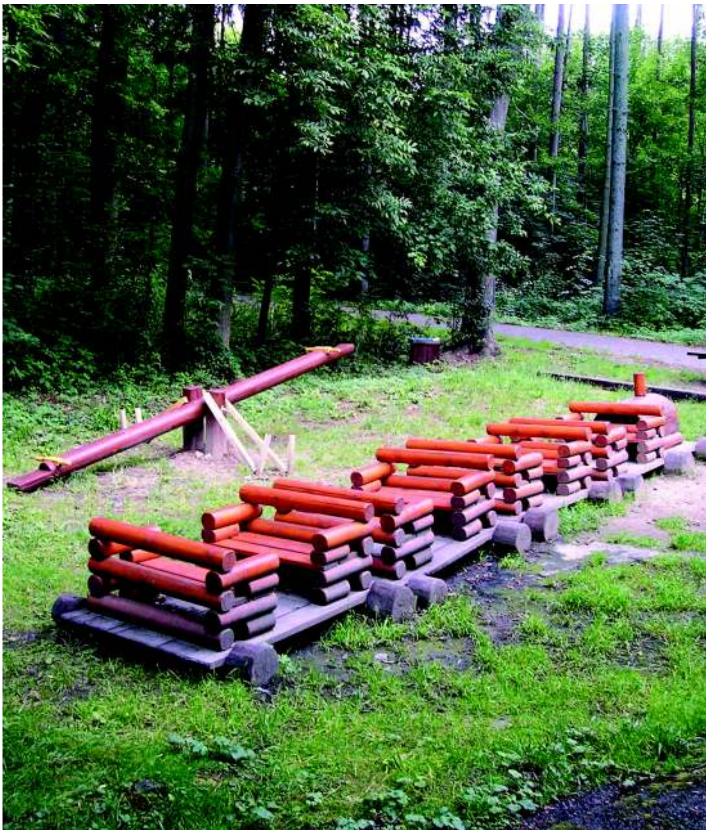
Vlak z Bažantnice je opět v plné kráse.