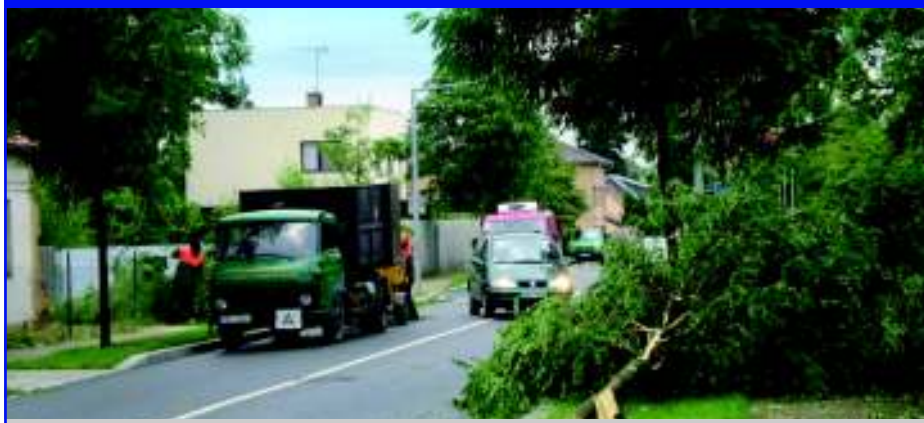
Dopoledne 16. srpna po nočních kroupách.