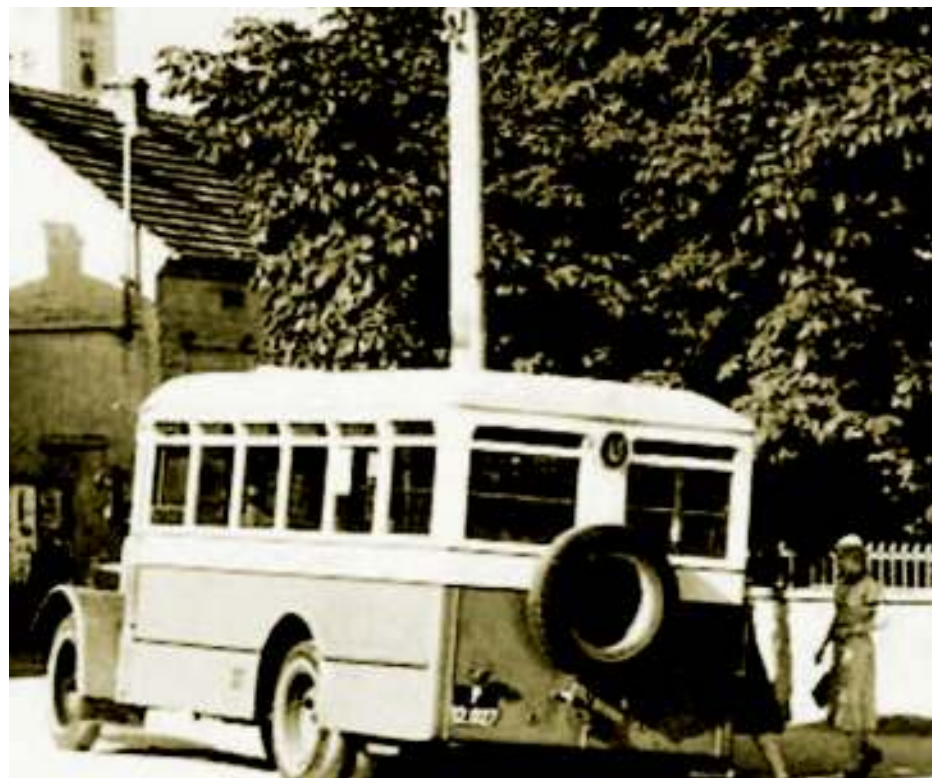
Na dnešním Nám. prezidenta Masaryka končí linka „U“. Obrázek přibližně konec září 1938.

Na samém okraji Kunratic, kde se říká U Dubu, stojí mohutný hraniční kunratický dub letní ( Quercus robur L. ). Dříve zde začínala pole, dnes můžete přes blízkou světelnou křižovatku dojít k mohutnému nákupnímu Centru Chodov. Dub má úctyhodné rozměry. Obvod kmene činí 424 cm a výška 18 m. Strom byl pravděpodobně vysazen ve druhé polovině 18. století. Tehdy se provádělo přeměrování katastrů. Dub byl hraničním stromem a jako takový podléhal zvláštní ochraně. 7. října 1998 byl prohlášen památným stromem. Takové stromy je zakázáno poškozovat, ničit a rušit v přirozeném vývoji. Jejich ošetřování se smí provádět podle přísných pravidel. Každý památný strom má ochranné