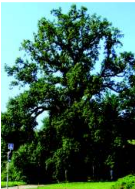
Hraniční kunratický dub letní.

pásmo ve tvaru kruhu o poloměru desetinásobku průměru kmene měřeného ve výši 130 cm nad zemí. Při vyhlásování památného stromu lze stanovit ochranné pásmo i větší. V tomto pásmu není dovolena žádná, pro památný strom škodlivá, činnost. Výstavba, terénní úpravy, odvodňování, chemizace a podobně. Památné stromy jsou evidovány v ústředním seznamu ochrany přírody. Z hlediska věkové struktury je možné rozlišit tři kategorie památných stromů. Památné stromy kmetického věku (nad 400 let), památné stromy zralého věku (200 až 400 let), mezi které patří i náš dub, a památné stromy čekatelé (mladého věku). Stromy jsou označeny tabulkou se státním znakem a názvem Památný strom. (my)