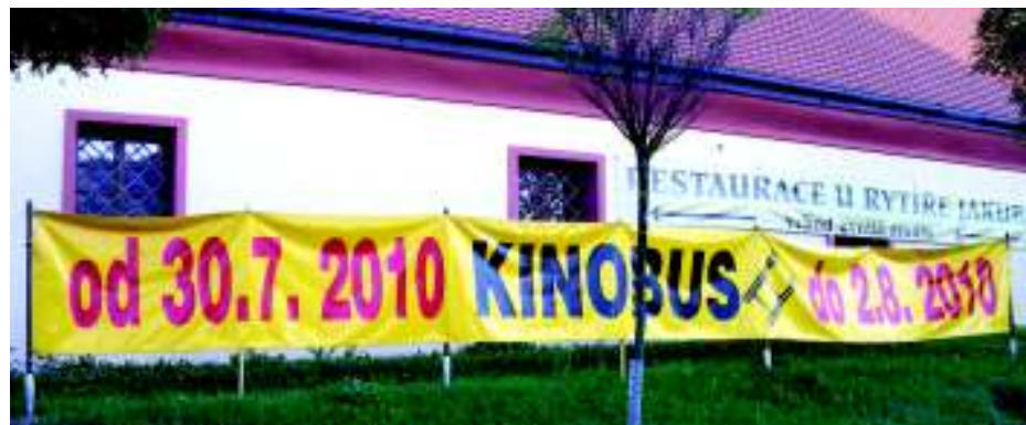
Pozvánka do kina.

2. srpna. Dorazily čtyři filmy. Dva novější, Protektor a Muži v říji a dva starší – Jak vytrhnout velrybě stoličku a Jak dostat tatínka do polepšovny. Ty snad musel již vidět každý. A přesto bylo každý večer plno. Těší nás, že pořadatelé považují „místo u Kunratického zámečku“ za nejoblíbenější. Letošní promítání ale předcházela nemilá událost. Při projekci 25. července v Uhříněvsi rozřezali vandaloové nafukovací plátno a promítání musela být od následujícího dne odvolána. I přes veškeré úsilí o splenění plátna vlastními prostředky se bohužel muselo počkat na profesionální lepící a letovací sadu z Německa. Naštěstí se vše stihlo tak, aby Kunratice promítat mohly. Jako obvykle trochu přšelo, ale Kunraticákům promítání v dešti nevadí, a tak se představení rušit nemusela. Jediné, co Kinobus opět trápilo, byly slabé jističe elektřiny. To ale zdejší diváci znají, a tak nebyli nijak zvlášť překvapeni. Následující den se vše odstěhovalo na další štaci na Opatov. (my)