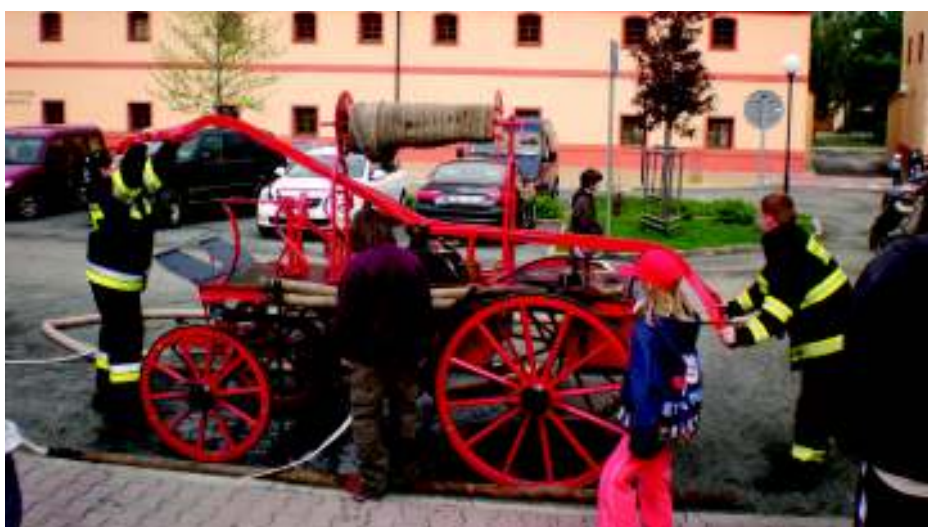
Motor je motor.