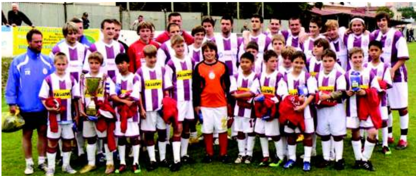
Fotbalové naděje.