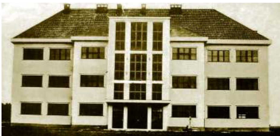
Novostavba školy z roku 1935.