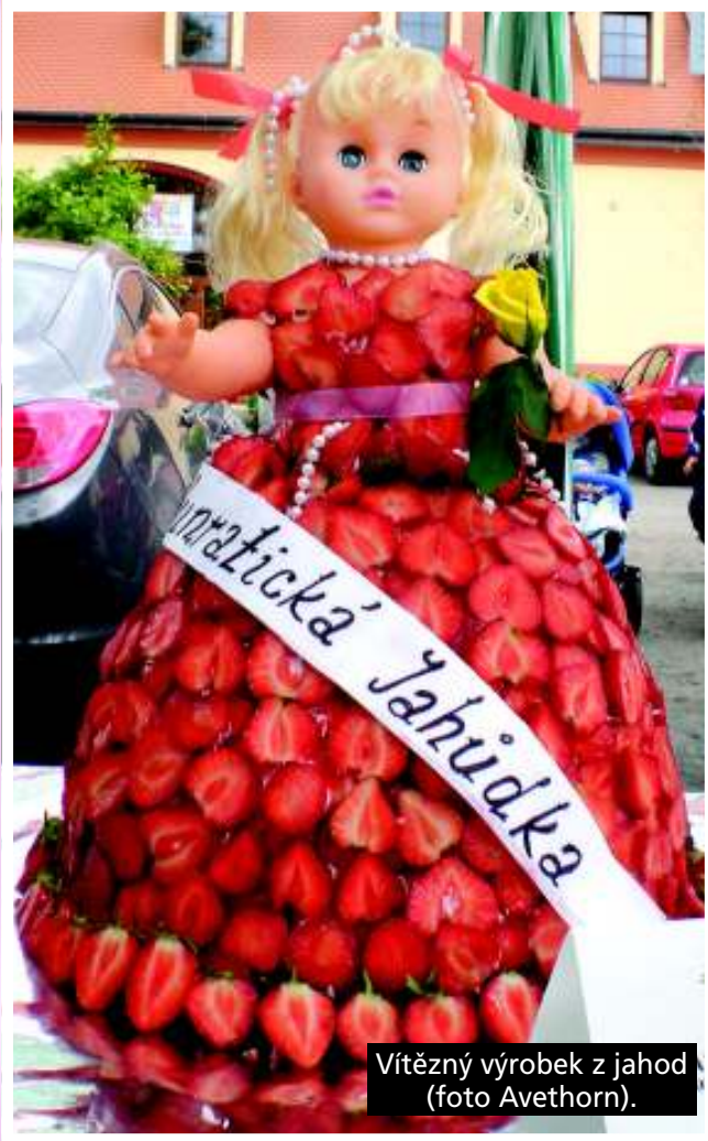
Vítězný výrobek z jahod.