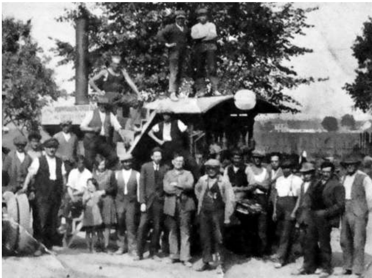
Asfaltování benešovské silnice před betáňskou hospodou roku 1925 (foto archiv paní Pubrdlové).