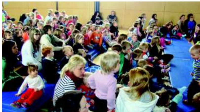
Děti se těší na pohádku O Koblížkovi (foto my).