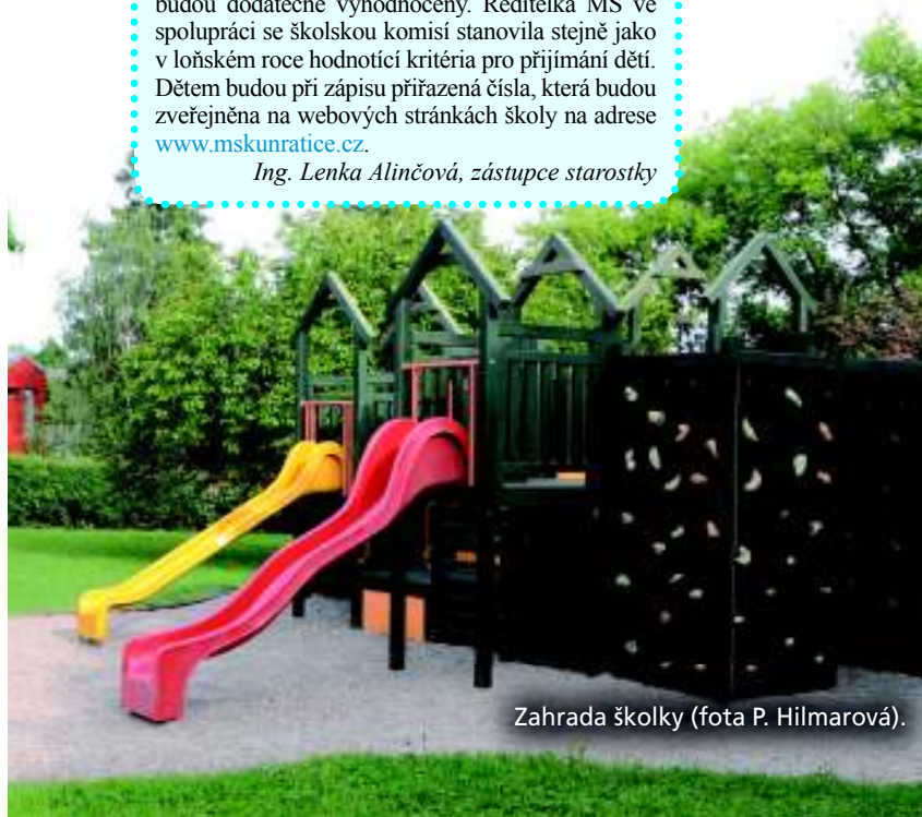
Zahrada školky.