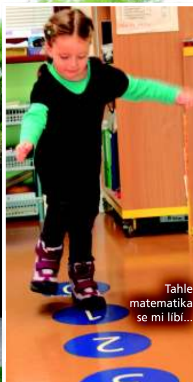
Tahle matematika se mi líbí...