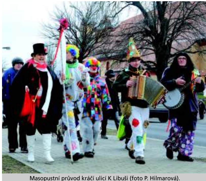
Masopustní průvod kráčí ulicí K Libuši.