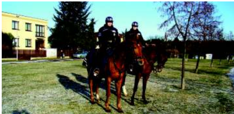
Policistky začínají službu v Kunraticích.

k osedlání. Je chladněji, a tak dostanou na hřbet před osedláním příkrývku, k zoufalství fotografa, s antireflexními pásky. Pak je ještě do úchyty sedla zasunut dlouhý, meč připomínající, obušek. A z rampy auta nasadnou na koně. Ne že by jezdkyne neuměly naskočit do sedla ze země, ale takto je to pro jejich čtyřnohé přátele šetrnější. Ještě obrázek do Zpravodaje a služba může začít. (my)