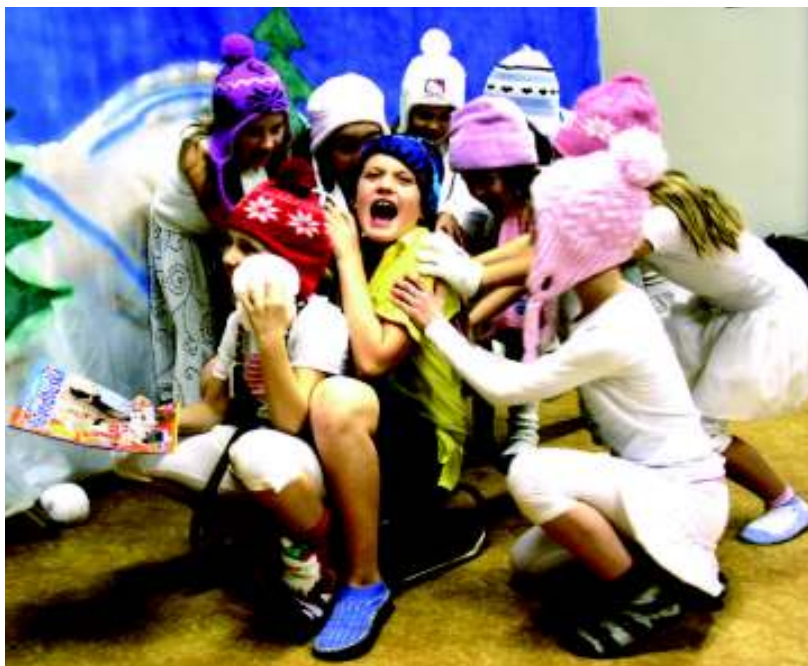
Kouzelné sánky.

Vrcholem sezony byla daleká cesta do Ameriky, do New Yorku. Celý pobyt od