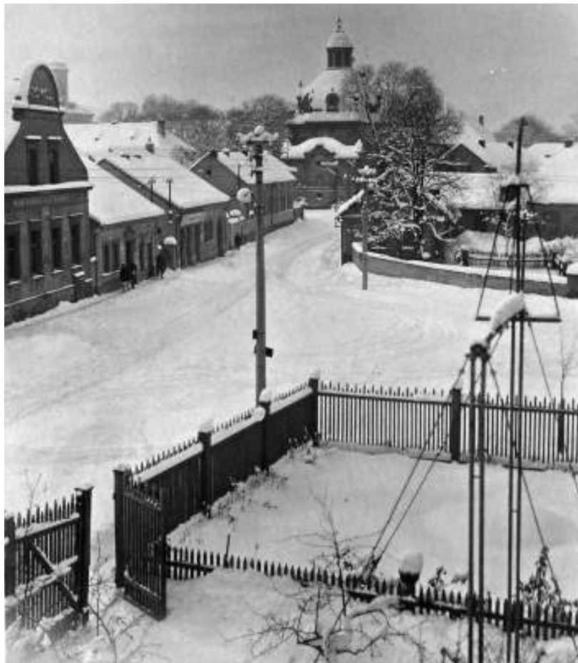
Náměstí prezidenta Masaryka.

Snímek dnešního Náměstí prezidenta Masaryka od ing. Peterky pochází přibližně z konce dvacátých let minulého století. Předzahrádka s hrazdou v popředí patří k budově bývalé firmy Adam, která vyráběla tělocvičné nářadí. Obrázek také ukazuje, jak se uklízel sníh. Každý před svým domem, hostinský ještě chodník propojil se silnicí. Koňské povozy po neuklizené silnici projely, a když to již nešlo, zapřáhly se saně. Těch několik automobilů, které tehdy existovaly, buď zkusilo štěstí, nebo raději nevyjelo. Tehdy platila zvyklost, že když je sníh, jede ten, kdo projede. (my)