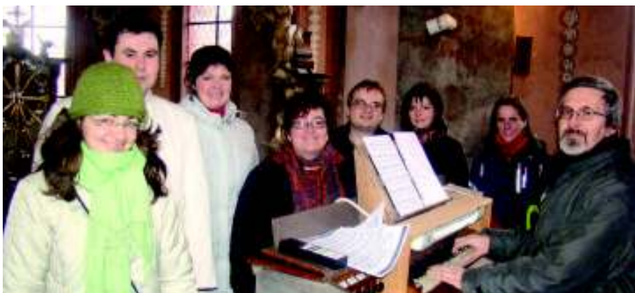
Kůrovci na kůru kunratického kostela.