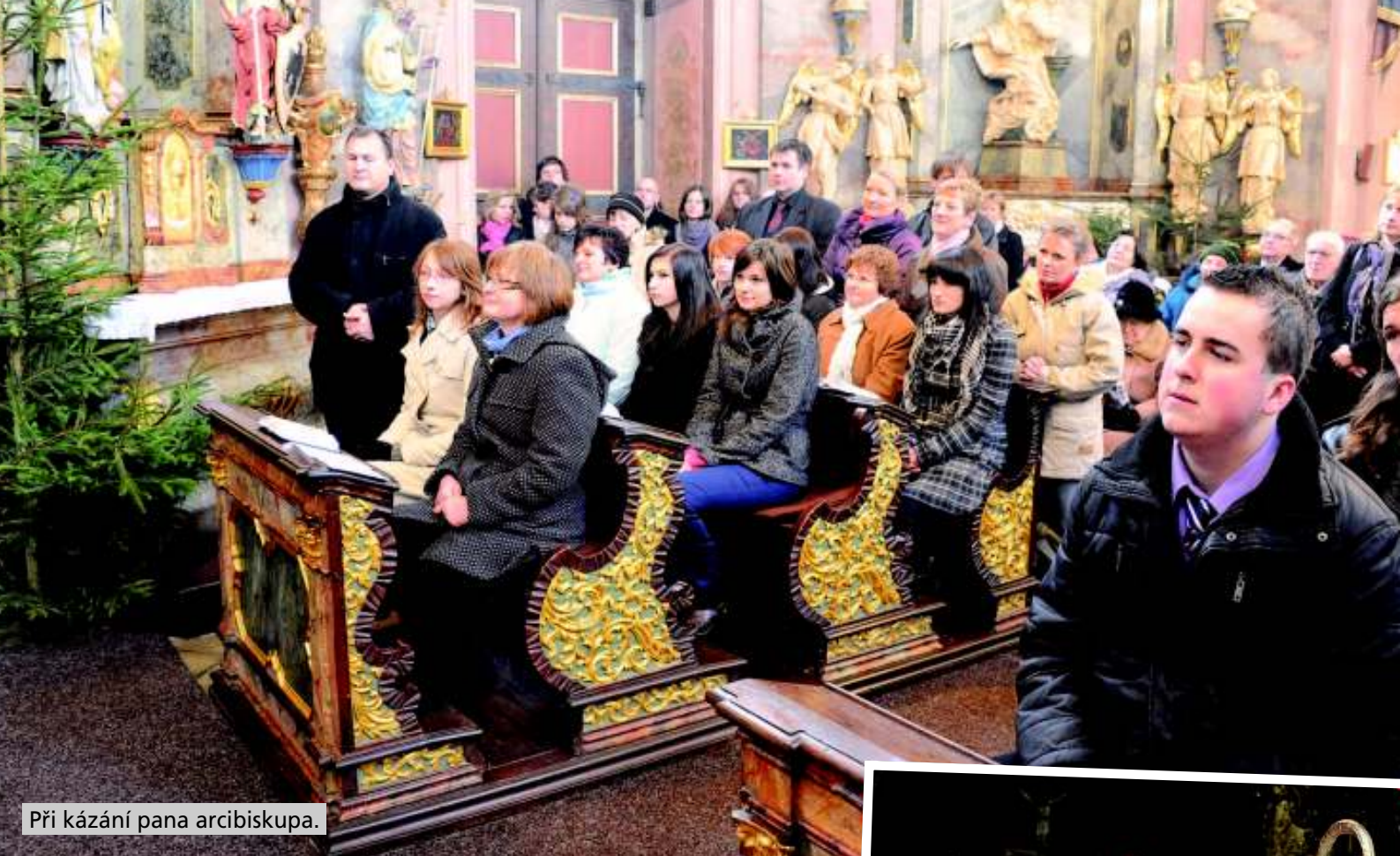
Při kázání pana arcibiskupa.