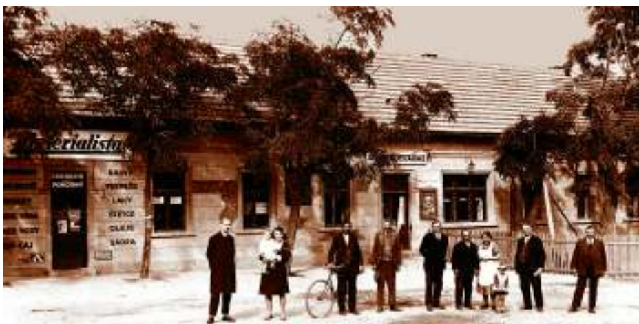
Sechtrova restaurace na snímku z třicátých let 20. století.

Z dalších přednesených informací bych vám nabídl jen několik málo aktivit, které sbor v roce 2010 prováděl. Ať již sa-