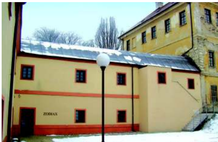
Nejstarší část bývalého pivovaru, navazující přímo na zámek.

V budově výsadní hospody na Libuši č. p. 1 je dnes sídlo pobočky České pošty a Oční