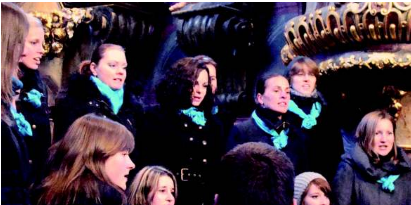
Pražská kantiléna zpívá v kostele.