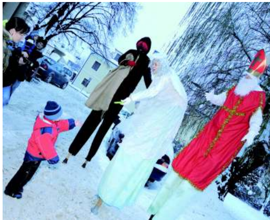
Mikulášská tradice v netradičním provedení.

Letos se bude pokračovat na stavbách zahájených v předešlém roce. Jsou to