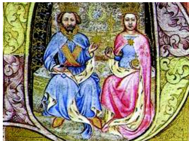
Václav IV. a Žofie Bavorská (Václavova Bible z 15. století).

V těsné blízkosti nové ulice Královny Žofie se nachází i kratší ulice K Novému hradu. Název připomíná místo pobytu královského páru Václava IV. a Žofie Bavorské v Kunraticích ve druhém desetiletí 15. století. Období nejznámějších majitelů Kunratic připomínají i další názvy kunratických ulic Ke Hrádku a Krále Václava IV. Název další ulice U Zeleného ptáka se vztahuje k obecní tradici, patrně z doby romantismu. Prý někde v Kunraticích existoval stejnojmenný hostinec kam král Václav při svých pobytech na Novém hradě chodíval. (my)