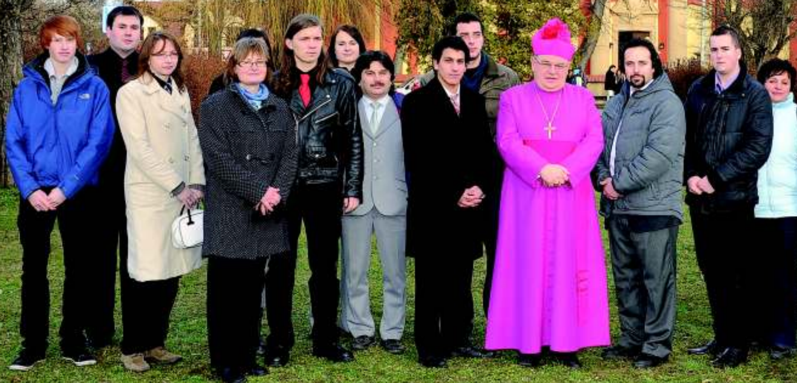
(Fotografie z návštěvy pražského arcibiskupa Mons. Duky zhotovil Ronald Hilmar).