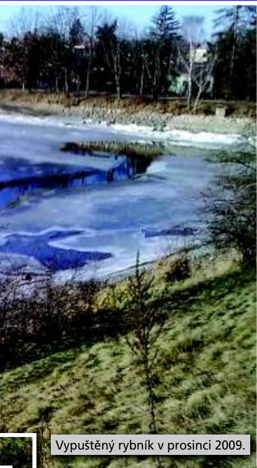
Vypuštěný rybník v prosinci 2009.