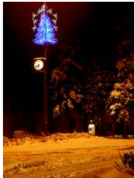
Vánoční výzdoba s lednovým sněhem.