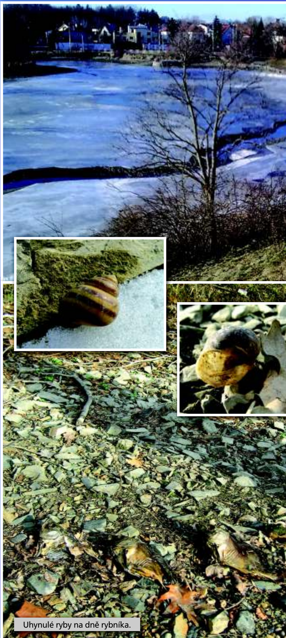
Uhynulé ryby na dně rybníka.