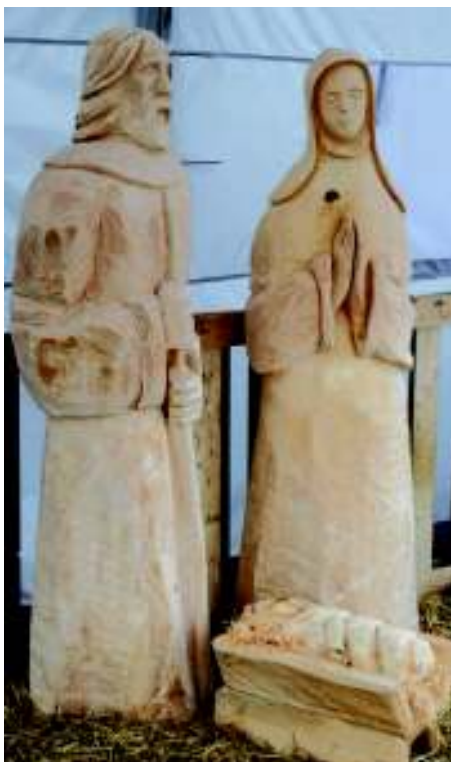
První postavy Betléma.