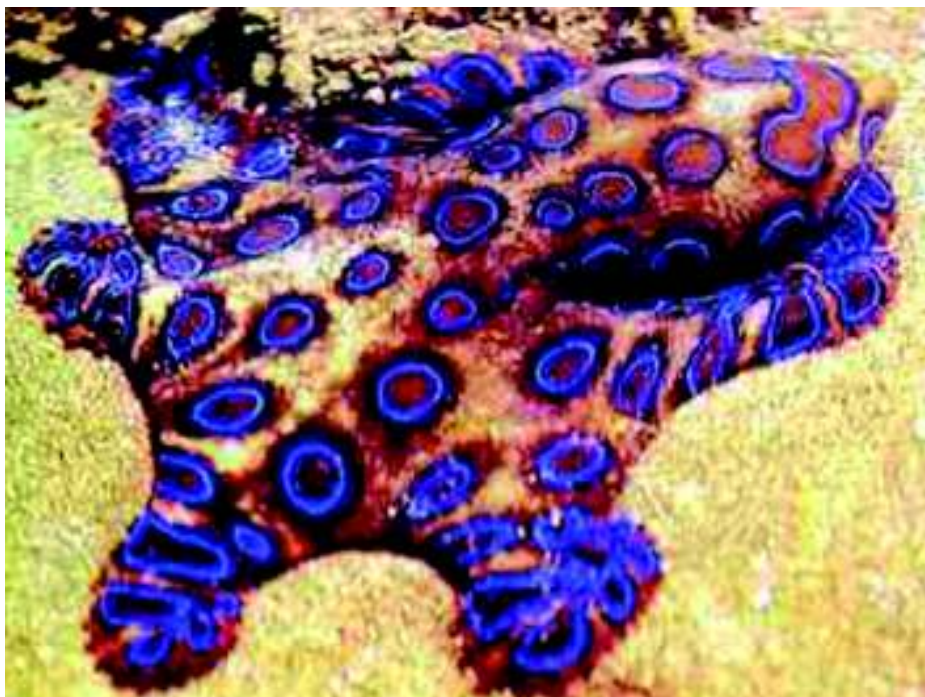
Nebezpečná kráska chobotnice modrokroužková (Hapalochlaena lunulata).