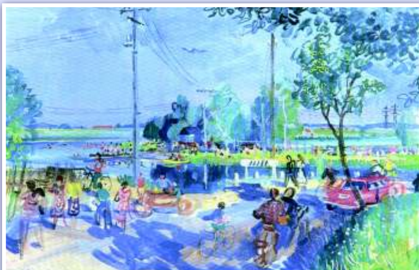
Na Šeberáku v létě. Jaromír Jindra, tempera, 60. léta 20. století.