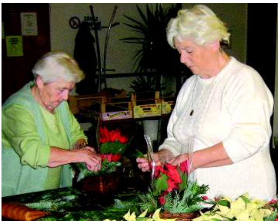
Výroba jede naplno (foto babeta).

Nejvíce se zdobily vánoční hvězdy. Každý si tu svou upravil podle vlastního vkusu. Výrobci byli se svým dílem spokojeni, a tak se můžeme domnívat, že dílna měla úspěch. Čas ale utíká a v době, kdy budete číst vzpomínku na aranžování vánočních hvězd, poklepou na dveře Velikonoce. Což znamená,