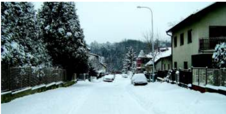
Sníh je velmi romantický, pokud nejezdíte autem.

daření, by s tím nesouhlasil. Doporučuji občanům z této lokality, aby se v případě nespokojenosti s úklidem obraceli na TSK tel. 244 462 494.