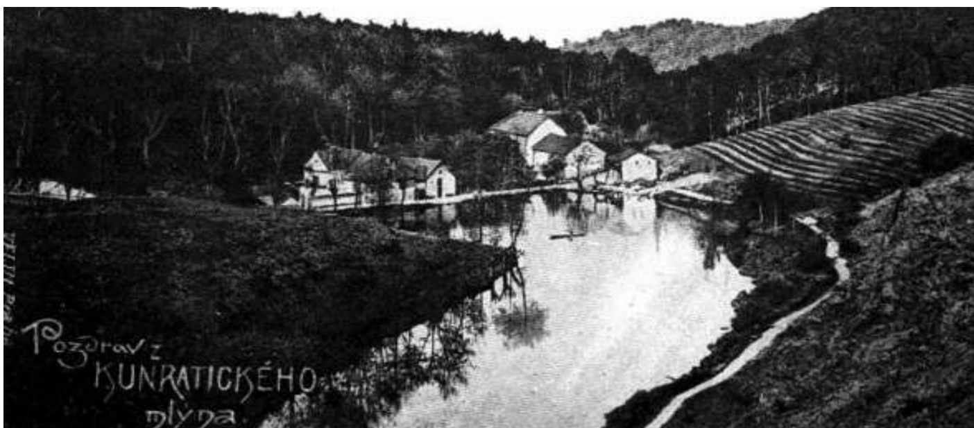
Dolnomlýnský rybník a vinice na počátku 20. století.