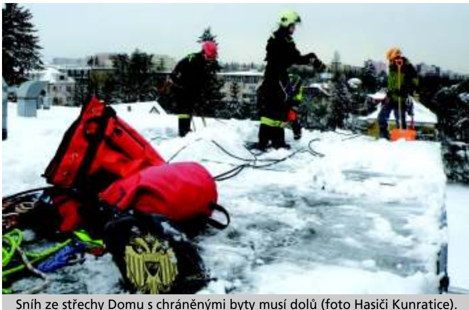
Sníh ze střechy Domu s chráněnými byty musí dolů.

(Uvádíme pouze vybraná usnesení Zastupitelstva, podrobnější informace www.praha-kunratice.cz ).