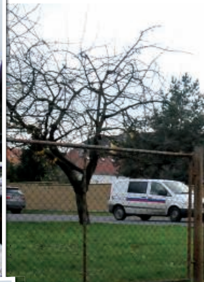
Ještědská ulice říjen 2013