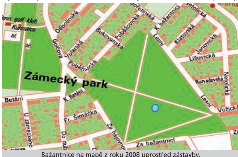
Bažantnice na mapě z roku 2008 uprostřed zástavby.