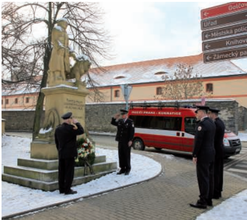
Obnovení prvorepublikové kunratické hasičské tradice, kladení věnce k pomníku padlým v 1. světové válce.

jak sbor, tak náročné hasičské řemeslo. Zde patří mimo jiné vyzdvihnout skupinu lezců, která prováděla např. odstraňování větví ve vysokých korunách stromů, záchranu osob z výšek apod.