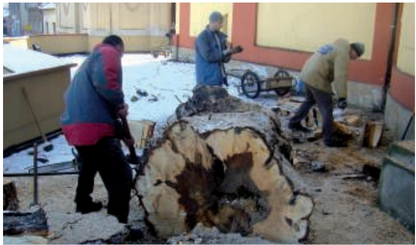
Nadělat polínka nebývá vždy jednoduché.

Pracovali, jak s oblibou říká Pater Hrach, za vatikánskou měnu Zaplat' pámbůh. Počítáme je na desítky. Další desítky návštěvníků Nazaretu od dětí po vážené seniory následně využijí jejich úsilí při různých přátelských setkáních u praskajícího krbu. (my)