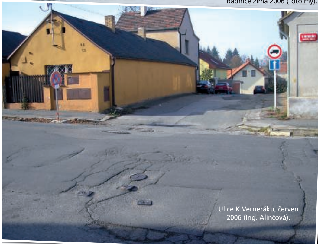
Ulice K Verneráku, červen 2006 (Ing. Alinčová).