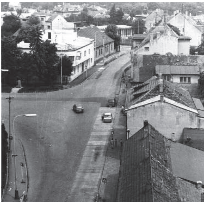
Náměstí prezidenta Masaryka a část Kunratic v roce 1983 (foto Robert Koblih).

Mezi novodobé významné investice patří rekonstrukce a dostavba mateřské a základní školy včetně sportovní haly, rekonstrukce a dostavba radnice, rekonstrukce č. p. 34 na Kostelním náměstí na služebnu městské policie, výstavba objektu Chráněné byty pro seniory v ulici K Zeleným domkům, rekonstrukce a dostavba hasičské zbrojnice v Bořetinské ulici, modernizace a rozšíření fotbalového areálu, rekonstrukce části zámeckého parku, která je ve správě kunratické radnice, výstavba několika zcela nových dětských hřišť, revitalizace rybníka Ohrada, rekonstrukce hospodářských budov kunratického zámku a koupaliště u rybníka Šeberák. V Golčově ulici v č. p. 24 vznikl po rekonstrukci a půdní vestavbě víceúčelový dům, kde našly umístě-