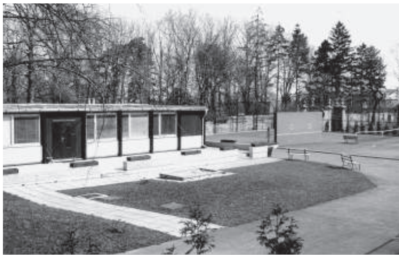
1984 byl dokončen nový areál nynějšího Tennis Golf Clubu.

Institut plánování a rozvoje hl. m. Prahy (dříve Útvar rozvoje hl. m. Prahy) byl pověřen hl. m. Prahou zpracováním návrhu novelizace vyhlášky č. 26/1999 Sb. hl. m.