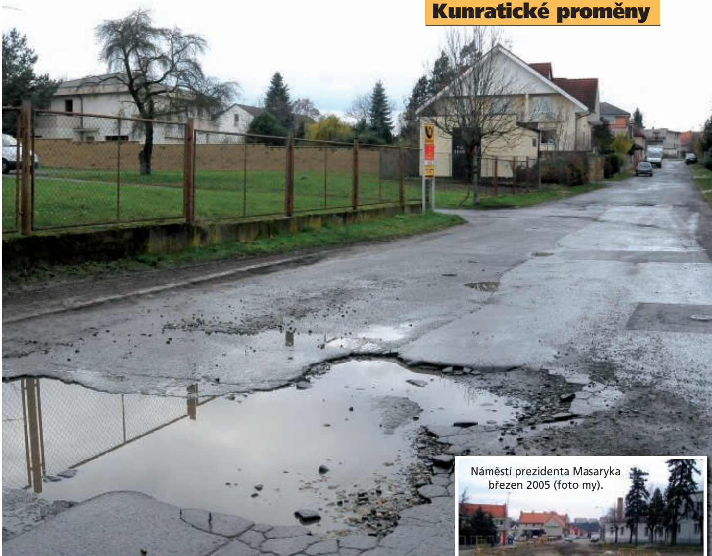
Náměstí prezidenta Masaryka březen 2005.