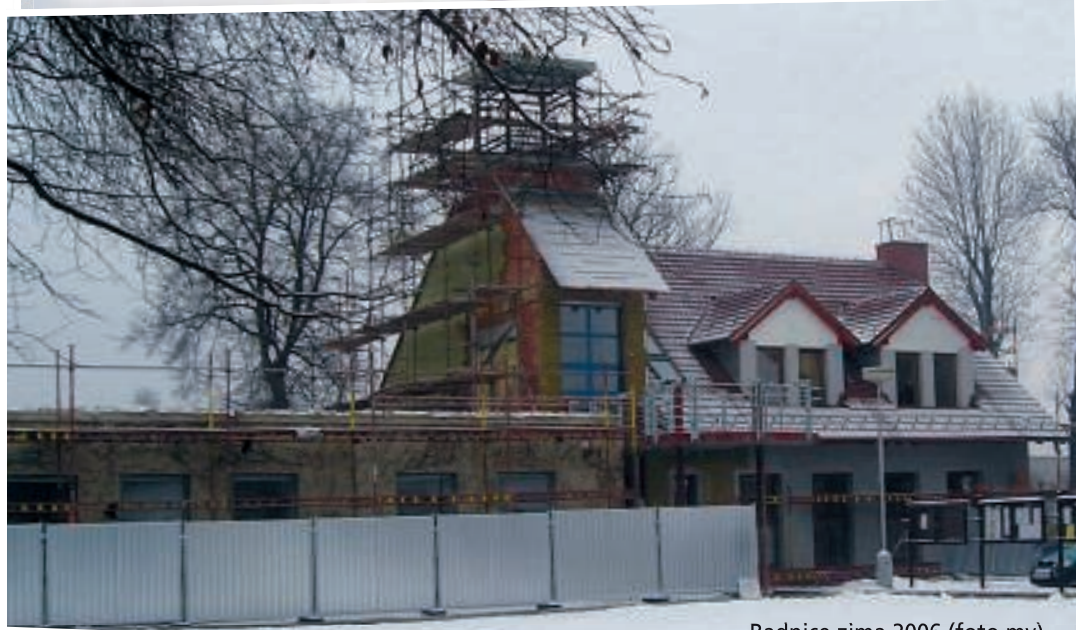
Radnice zima 2006.