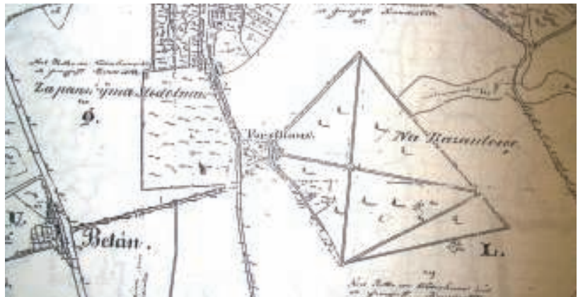
Bažantnice na mapě z roku 1841 obklopena poli.

Pravděpodobně po roce 1801, kdy Kunratice vlastnil rod Korbů byla založena bažantnice, ohraničený lesík určený k chovu bažantů. První bažantnice se začínají v Čechách objevovat již od 11. století. Kunratická je vyznačena na historické mapě z roku 1841. Musela vzniknout mezi rokem 1750, kdy si jí tolik panský písař přál a letopočtem uvedeným na mapě. Její tvar a rozloha se téměř shoduje s mapou z roku 2008. Na staré mapě je obklopena poli a na nové již zástavbou. Dva památné duby letní v dnešní Bažantnici (v prodloužení Lišovické ulice a u můstku) jsou staré přibližně 150–200 let a patří pravděpodobně k původním.