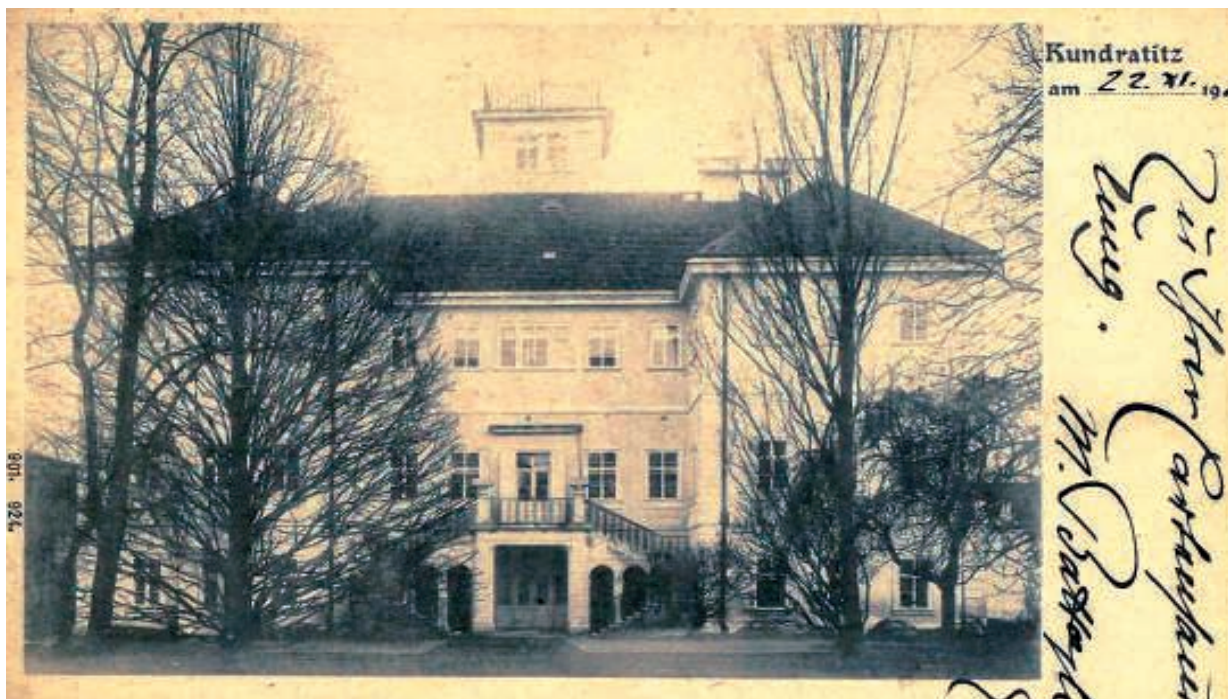
Pozdrav ze 2. listopadu 1901 (sbírka pohlednic manželů Benešových).

Pozvánka na směnu na pomoc maďarskému lidu v Kunraticích z listopadu se vztahuje k událostem z roku 1956. Oficiálně se o nich u nás mluvilo tak, jak je uvedeno na pozvánce na brigádu. Vše ale bylo jinak. Teror, násilné zavádění družstevnictví a absurdní zásahy do ekonomiky přivedly