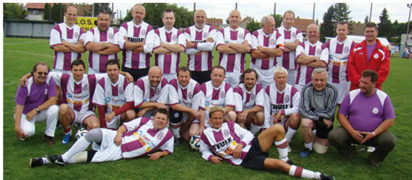
Kunratická stará garda před utkáním s tradičním libušským rivalem (foto my).