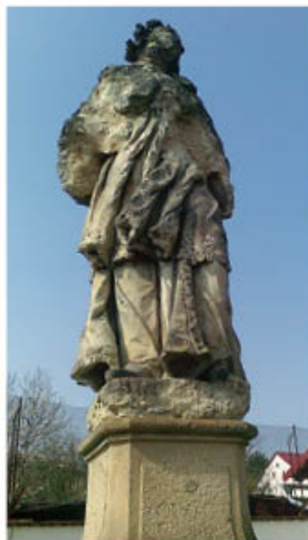
Socha sv. Jana Nepomuckého.

Červnové jednání komise školství, kultury a sportu se zabývalo sochou sv. Jana Nepomuckého, která stojí vedle restaurace Na Zelených domkách. Socha je dle odborníků natolik narušená, že každá silnější zima (střídání mrazů a oblev, zatékání vody)