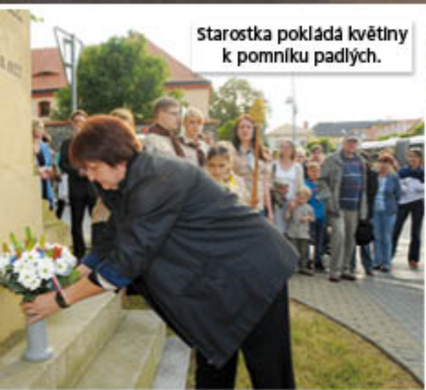
Starostka pokládá květiny k pomníku padlých.