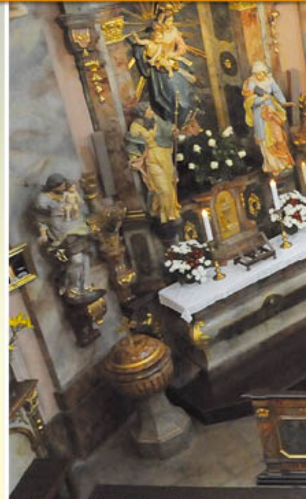
Vzpomínková Mše Svatá v kunratickém kostele.

nosti začalo až 1. světovou válkou, která rozmetala společenský řád a jistoty naší tehdejší civilizace, otřásla jejími hodnotami a urychlila jejich změny. Po stáletích trvalého vytváření a prosazování svobodné občanské společnosti začaly vznikat moderní totality a společenské násilí v nepředstavitelném rozsahu. Ještě nikdy v historii se politici a vojevůdci tak nemýlili. Očekávali krátké vojenské střetnutí. Kulometry a děla zahaly vojáky na roky do zákopů a zisk každého území byl zaplacen tisíci mrtvými. Důsledky válečných i totalitních běsnění ve 20. století přetrvávají dodnes. (my)