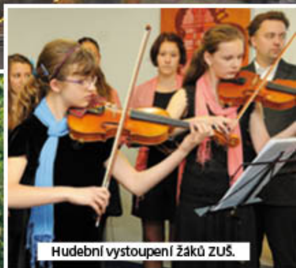
Hudební vystoupení žáků ZUŠ.