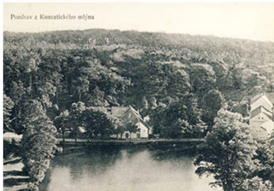
Pozdrav z Kunratického mlýna

Šeberák hýbe Kunraticemi. Není to jenom nějaký rybník v nějaké vesnici se kterým si každý majitel může zacházet jak se mu zlíbí. Pro kunratické občany představuje i něco víc. Lidé se v Šeberáku v létě odjakživa koupali. Takzvané organizované koupání můžeme