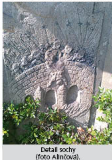
Detail sochy.

by ji mohla nenávratně zničit. Je na místě zmínit osud této cenné sochy. V roce 1736 nechal hrabě Jan Arnošt z Golče na místě zbořeniny Nového hradu postavit kapli sv. Jana Nepomuckého. Uvnitř byla umístěna socha sv. Jana stejného jména. V roce 1787 byla kaple zrušena a osud sochy je po dobu téměř 200 let neznámý. Někdy v padesátých letech 20. století se socha objevila na pozemku parc. č. 723, parkovišti pohostinství Na Zelených domkách. V roce 2002 prodalo Hl. m. Praha pozemek parkoviště i s pohostinstvím. Jeho majitelé se za vlastníka sochy nepovažují. Dle vyjádření Národního památkového ústavu (NPÚ) i Odboru památkové péče hl. m. Prahy se