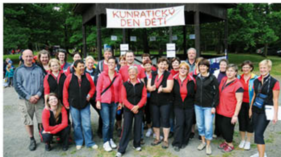
Pořadatelům 32. kunratického dne dětí v parku se sluší poděkovat.

14. června odpoledne patřil zámecký park dětem. TJ Sokol Kunratice pořádá tradiční Kunratický den dětí, letos 32. ročník. Počasí nám přálo, pro děti byly připraveny soutěžní disciplíny a doprovodný program. Sportovní odpoledne začalo u sítanu ukázkou první pomoci zraněnému cyklistovi. Po vyslechnutí organizačních pokynů se děti rozeběhly po parku plnit úkoly dle jednotlivých kategorií. Všechny děti pak obdržely tradičně diplom a dárkový balíček, pro vítěze byly připraveny hodnotné ceny. Pro všechny děti byl zajímavý doprovodný program. Malé děti jezdily vláčkem, starší zkoušely lukostřelbu a prohlížely hasičské vozy. V letošním roce s námi spolupracovala Městská policie