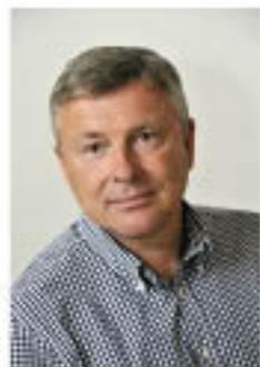
Ing. Pavel Cihák, poslanec PSP ČR, 54